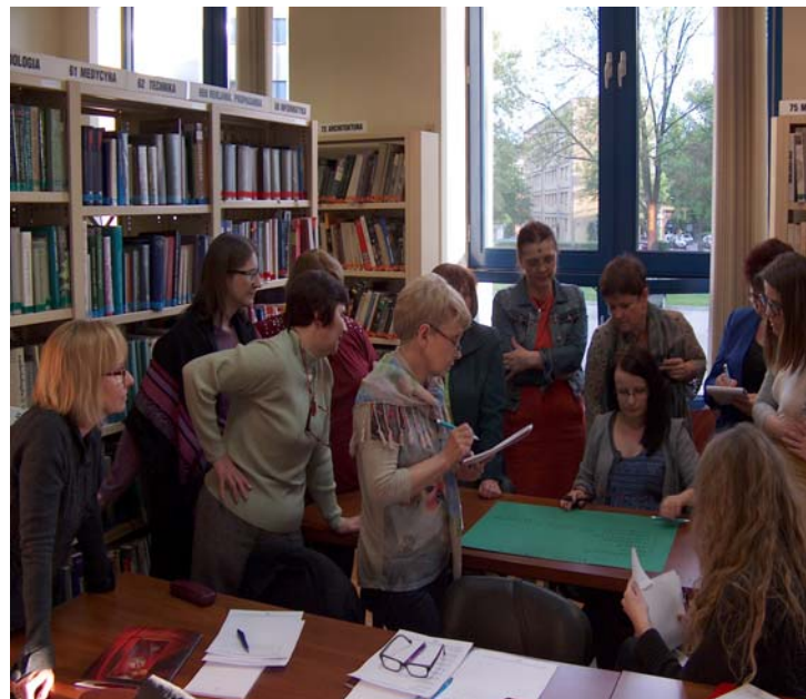
Fot. 5. Warsztaty Style osobowości: jakim typem kolorystycznym jesteś? .