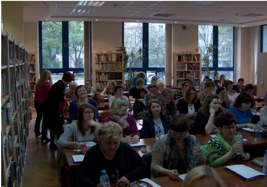
Fot. 7. Uczestnicy spotkania w Czytelni Głównej.

Na zakończenie spotkania poproszono Uczestników o wypełnienie ankiety ewaluacyjnej, która była złożona z 10 pytań. Została ona wypełniona przez 50 bibliotekarzy z 80 osób biorących udział w projekcie, co stanowi 63% ogółu. Poniżej zostaną przedstawione wyniki.