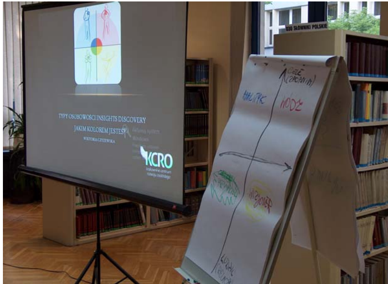
Fot. 2. Warsztaty Style osobowości: jakim typem kolorystycznym jesteś?

Wykład Tamary Bieńkowskiej Kobiety rządzą! miał na celu ukazanie roli kobiet jako liderów w organizacji. Przeanalizowano problemy dotyczące istnienia zasadniczych różnic pomiędzy liderkami i liderami, ich predyspozycji oraz stylu przywództwa. Podczas spotkania zaakcentowano, że przeciętny mężczyzna i przeciętna kobieta z natury bardzo się różnią. W wielu dziedzinach życia społecznego XXI wieku pojawia się potrzeba wykorzystania wrodzonych talentów kobiet. Kobiety w dziejach wielokrotnie wykazały się swoimi wyjątkowymi zdolnościami: umiejętnością odczytywania niewerbalnych przekazów, wrażliwością emocjonalną, empatią, cierpliwością, umiejętnością robienia kilku rzeczy naraz, skłonnością do współpracy, umiejętnością nawiązywania porozumienia i sprawiedliwym zarządzaniem.[3] W naszej opinii wykład był bardzo inspirujący i skłaniający do przemyśleń nad dotychczasowym sposobem postrzegania własnego życia i funkcjonowania w przestrzeni społecznej.