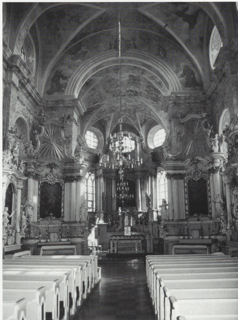
Wschowa, kościół p.w. św. Józefa — widok na ołtarz główny, ołtarze boczne i polichromie, stan po konserwacji.

Inwestor: Generalny Konserwator Zabytków i Wojewoda Leszczyński.