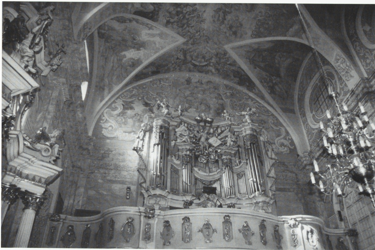
Wschowa, kościół p.w. św. Józefa — chór, stan po konserwacji.