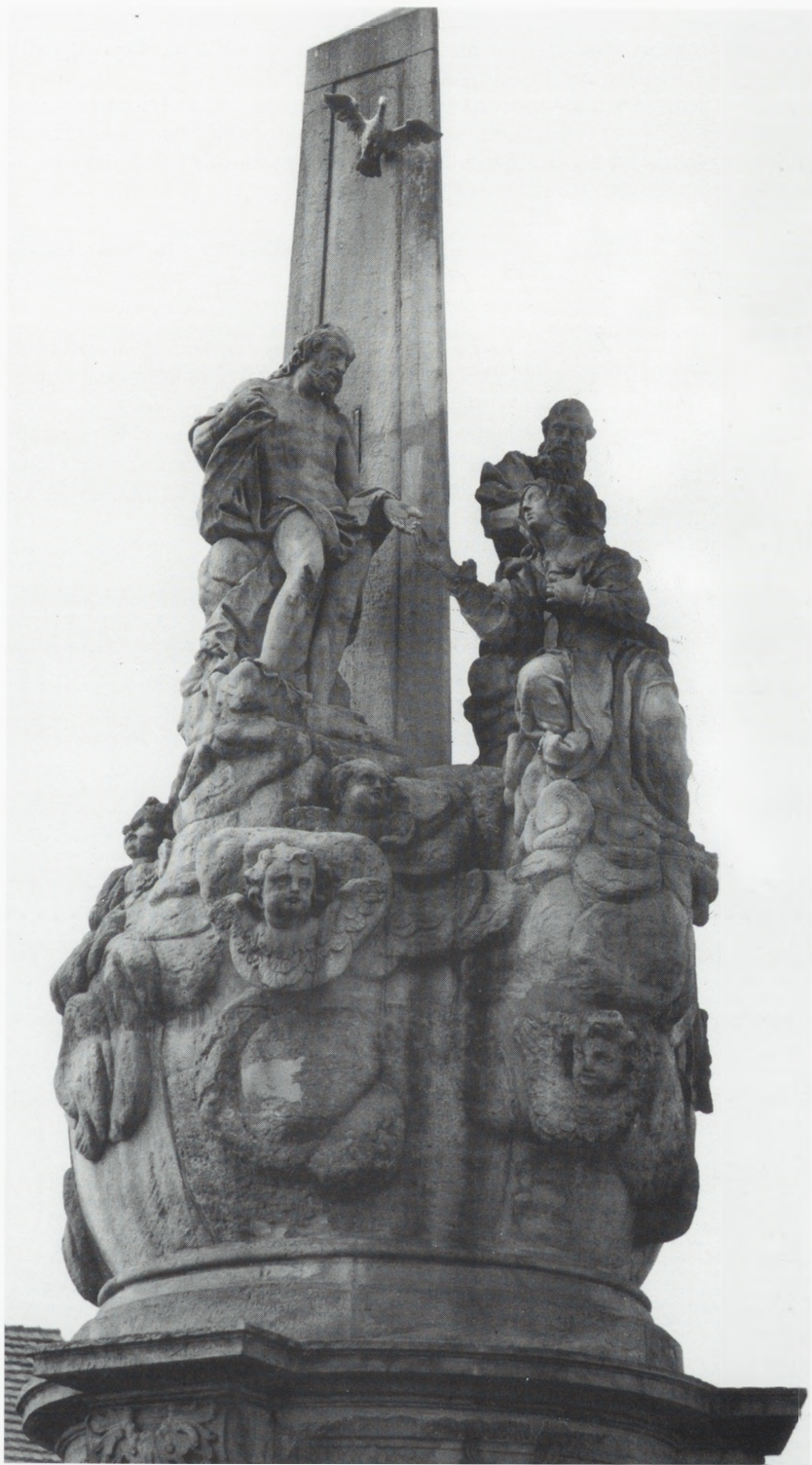
Rydzyzna, kolumna Trójcy Św. , jedyna w Wielkopolsce, dzieło Andrzeja Schmidta z l. 1760–1761.

Inwestor: Generalny Konserwator Zabytków, Parafia.