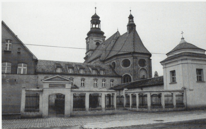
Wschowa, kościół p.w. św. Józefa i klasztor franciszkanów.

pierwotną, barokową kompozycję, w tym pierwotną kopułę.