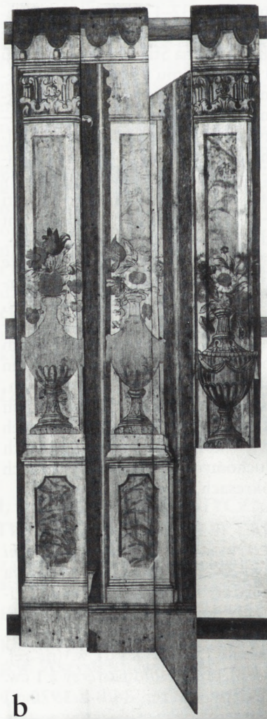
Osiek — fragment polichromii z ok. 1736 r. przed i po konserwacji.