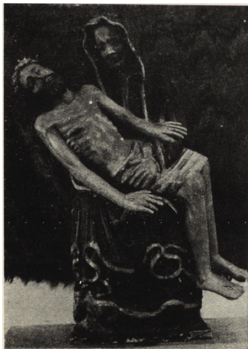
Ryc. 142. Świerzczynki, pow. Toruń — Pieta w kościele par.

Kikół (pow. Lipno) — pałac klasycystyczny będący własnością rodziny Zboińskich, zniszczony po wojnie jest obecnie odbudowywany i adaptowany na dom wczasowy (ryc. 137).