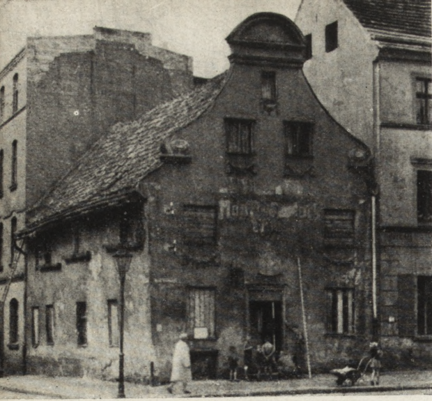
Ryc. 147—149. Toruń — gospoda „pod Modrym Fartuchem”. Stan przed, w czasie i po konserwacji.