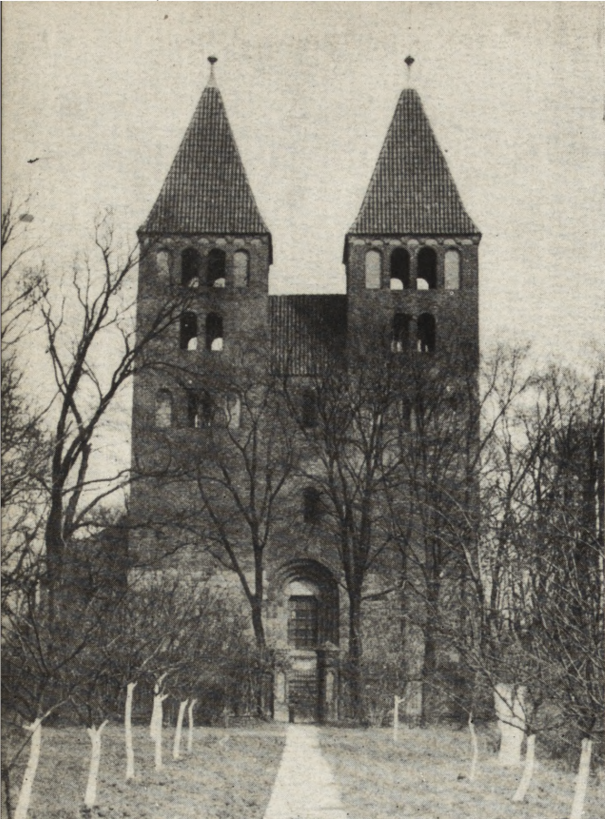
Ryc. 139. Inowrocław — kościół NMP.