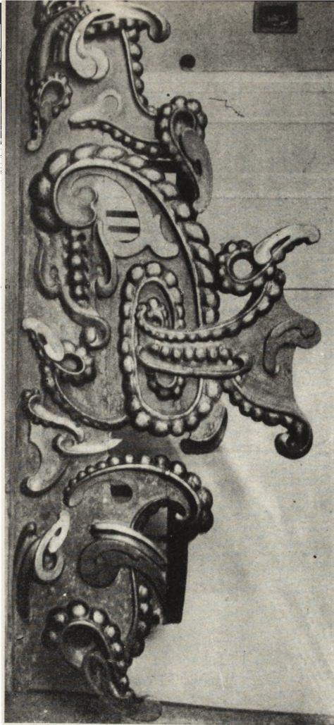
Ryc. 145. Bydgoszcz — ucho ołtarza gł. kościoła klarysek.

łych belek, wzmocniono konstrukcję dachową oraz pokryto dach gontem.