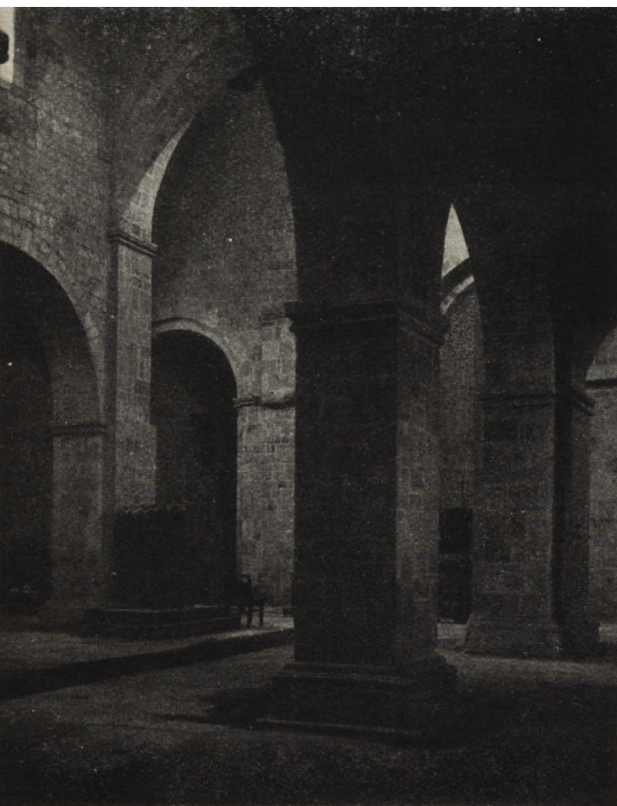
Ryc. 140. Kruszwica, pow. Inowrocław — wnętrze kolegiaty, 1957.