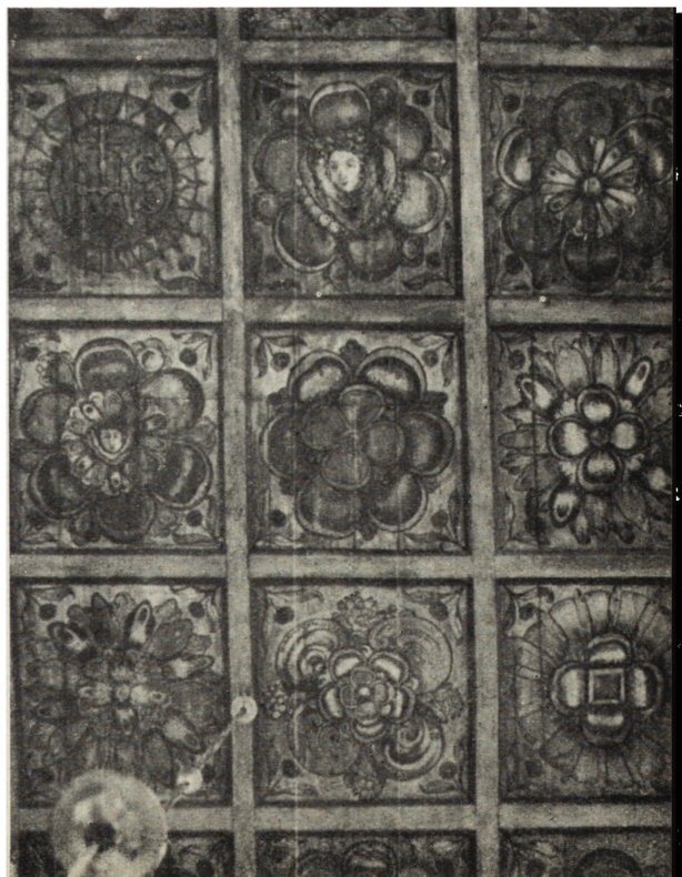
Ryc. 144. Bydgoszcz — polichromia stropu kościół klarysek po konserwacji, 1954.