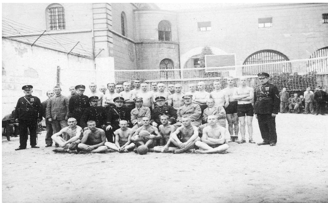
Fot. 3. Zajęcia z wychowania fizycznego w więzieniu w Kaliszu