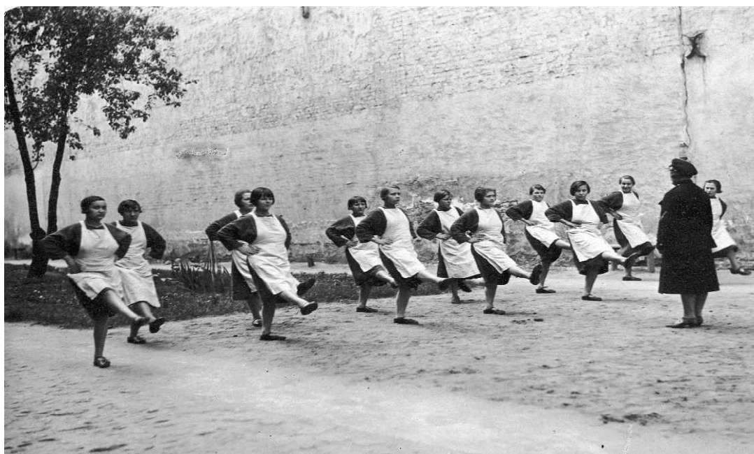
Fot. 2. Więźniarki podczas ćwiczeń w więzieniu w Tarnowie

było wypracowanie w osadzonych poczucia dyscypliny, zapobieganie – poprzez regularne ćwiczenia gimnastyczne i sportowe – ujemnym skutkom pozbawienia wolności na stan zdrowia więźniów. Wychowanie fizyczne realizowano w salach gimnastycznych (jeśli w zakładach takie istniały) albo na specjalnie do tego celu przygotowanych terenach ćwiczebnych, o ile to możliwe na świeżym powietrzu. Ćwiczenia odbywały się pod kierunkiem wykwalifikowanych instruktorów oraz pod nadzorem lekarzy. Istotne było także to, że wychowaniem fizycznym objęci zostali wszyscy więźniowie – zarówno mężczyźni, kobiety, jak i małoletni 23 .