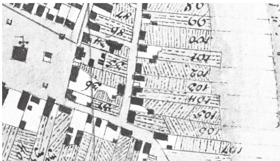
Il. 3. Parcele miejskie w Dolsku pod koniec XVIII w. Fragment planu Dolska z lat 1794–1796, Zakład Atlasu Historycznego IH PAN, szklane kopie Henryka Müncha, sygn. 44

liwość. Właściciele miast, z różnych powodów, dążyli do kontrolowania obrotu nieruchomości, być może to w ich interesie leżało, aby zbywana nieruchomość była dokładnie opisana 107 . Rozważyć należałoby w końcu samą osobę pisarza wprowadzającego wpis do księgi i jego decyzję (lub jej brak) o dokładniejszym opisanu sprzedawanej nieruchomości. Kolejnym problemem interpretacyjnym jest określenie, co znaczy opisanie ogrodu leżącego jako „przy” („adiacente”) domu: bezpośrednią bliskość i sąsiedztwo domu i ogrodu czy raczej fakt stanowienia jednej działki przez dom i ogród, choć mogły być one położone w innych miejscach 108 ?