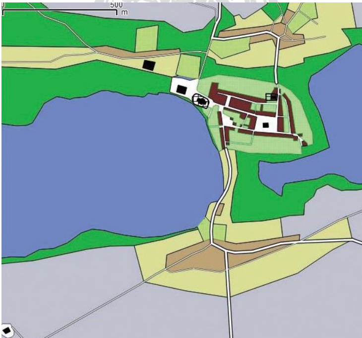
Il. 5. Plan rekonstrukcyjny Dolska z drugiej połowy XVI w. z oznaczonymi strefami mieszkalno-gospodarczą i ogrodową