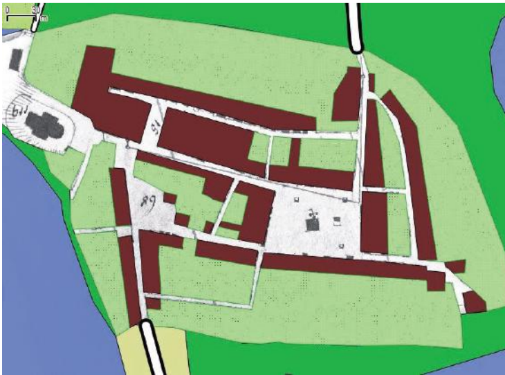
Il. 4. Plan rekonstrukcyjny Dolska z drugiej połowy XVI w. z oznaczonymi strefami mieszkalno-gospodarczą i ogrodową. Zbliżenie na centrum miasta