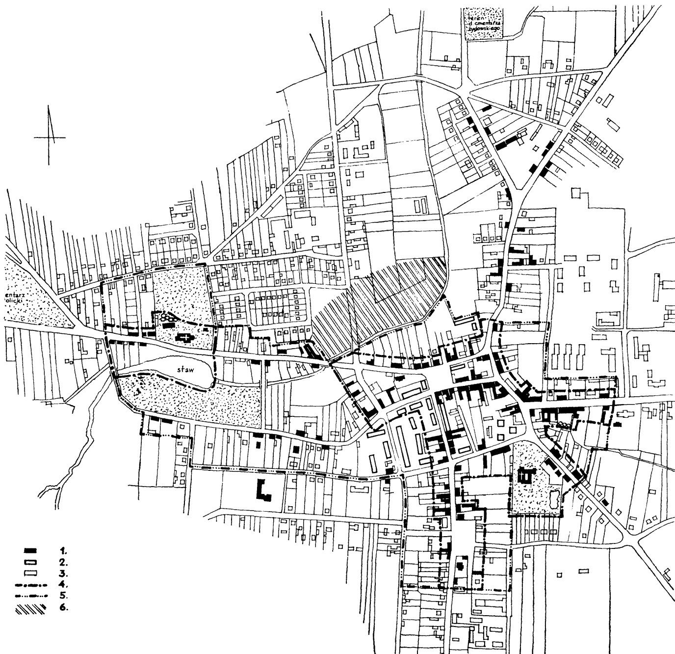
1. Brzeziny skala 1:10000 (wg studium PKZ opracowanego przez E. Bergman): 1 - obiekty zabytkowe, 2 - obiekty dysharmonizujące, 3 - obiekty inne, 4 - granica strefy „A”, 5 - granica strefy „B”, 6 - strefa „OW”

3. Istniejące zniekształcenia historycznej kompozycji przestrzennej (np. likwidacja części dawnych ulic, zabudowa nowsza nie harmonizująca z dawniejszą, zasypianie dawnych cieków wodnych) są na tyle niewielkie lub zasób informacji historycznych, archeologicznych i innych na tyle duży, że możliwe jest usunięcie elementów dysharmonizujących oraz restytucja dawnego układu przestrzennego w zakresie cech urbanistycznych (np. przebieg i przekroje ulic, skala i bryła zabudowy, zwłaszcza w najważniejszych miej-