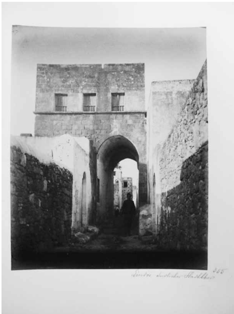
Fig. 2. Lindos. Ulica w mieście

i talerze tutejsze, bogato ornamentowane w różnobarwne kwiaty, o perskim rysunku i przepysznej kolorystycznej gamie, błyszczą jeszcze jak klejnoty na ścianach wielu domów, są bardzo, bardzo poszukiwane i sławne, lecz należą już do rzadkości, za którą się drogo płaci” 18 . Talerze z Rodos K. Lanckoroński wystawił w Österreichisches Museum für Kunst und Industrie we Wiedniu.