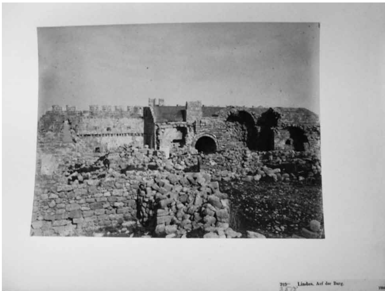
Fig. 6. Lindos. Akropol