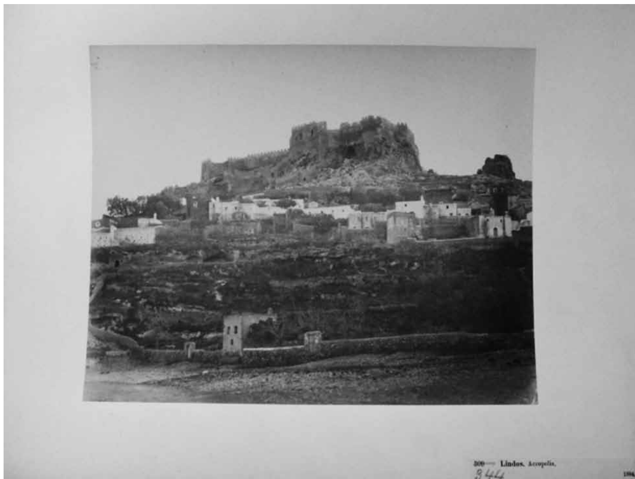
Fig. 4. Lindos. Widok na akropol