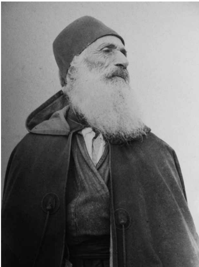
Fig. 3. Portret Greka z Lindos

krakowskich zdjęć z Rodos jest około 60 26 . Są to fotografie Rodos, Lindos, Archangelos, Petrony i Messary. Przynajmniej w części są one dziełem F. von Luschana. Wśród owych 60 zdjęć są pojedyncze fotografie mieszkańców wyspy Rodos (Fig. 3) 27 . Ich wykonanie związane było, przynajmniej w poważnej części, z antropologicznymi studiami dr. F. von Luschana. Wśród fotografii