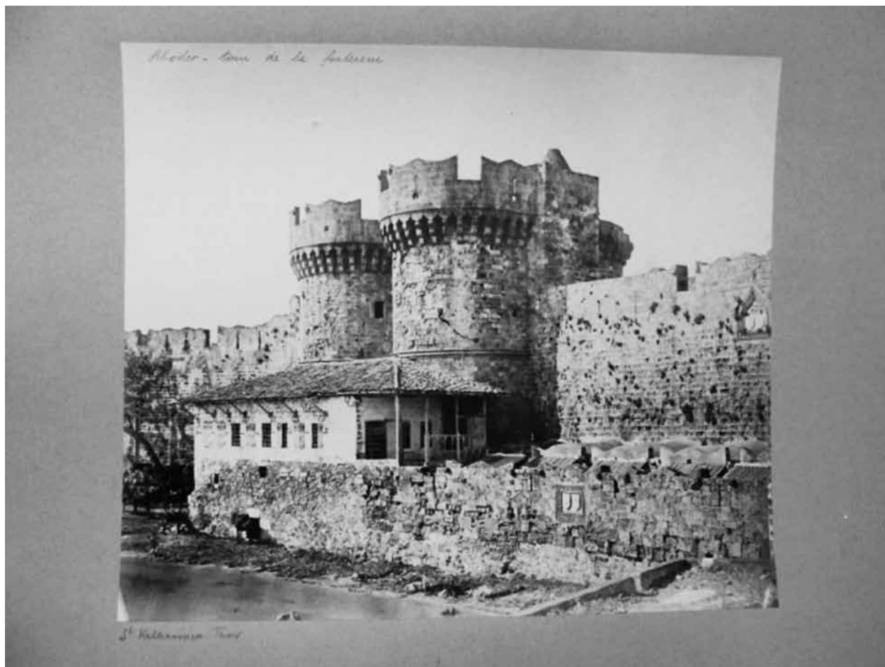
Fig. 7. Rodos. Mury i brama miasta

i sztuką, unieśmiertniło się przede wszystkim tą latarnią morską w formie kolosu z brązu odlanego, przedstawiającego Heliosa-Apollina, ze światłem nocą gorejącem w podniesionej dłoni, który wykonany przez Charesa z Lindos, należał do siedmiu cudów świata 39 . Dzisiaj głównie ono uderza i imponuje pomnikami średniowiecznymi, które rycerze jerozolimscy przez wiek XIV i XV, od r. 1309 do 1522 w nim wzniesli 40 (Fig. 7). Zabytki starożytne go nie zainteresowały, chociaż zwracał uwagę, że w ściany domów, nad drzwiami, czy też w innych dowolnych miejscach umieszczono rzeźby greckie 41 . Być może powodem takiej opinii było przekonanie, że Rodos „w najświetniejszych swych czasach przypominało więcej Seleucyję, Antiochię i Aleksandryę, niż Rzym i Ateny 42 . Wśród najciekawszych obiektów nie znalazł się nawet akropol Rodos (Fig. 8).