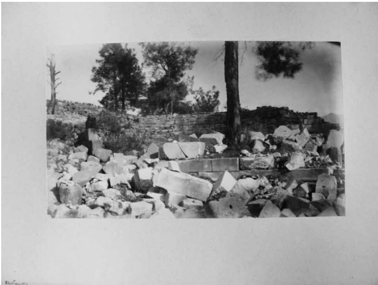
Fig. 8. Rodos, Akropol