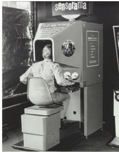
Rysunek 2. Sensorama