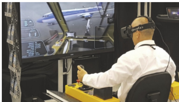
Rysunek 6. Aircraft de-icing operator training simulator

symulatory wirtualnej rzeczywistości są już wykorzystywane w programach szkoleniowych pracowników naziemnych w porcie lotniczym. W trudnych warunkach pogodowych takich jak: śnieg, lód, mróz, zimny deszcz, wiatr itp. szkolenia z użyciem nowych technologii są idealnym rozwiązaniem dla zespołu odpowiedzialnego za obsługę samolotu na ziemi. Przykładowo czyszczenie płyty lotniskowej i odladzanie samolotu pochłania zespół wielu osób odpowiedzialnych za zapewnienie bezpiecznych warunków do ruchu lotniskowego jak i samego lotu samolotu.