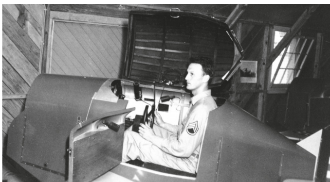
Rysunek 1. Symulator lotu — „link trainer“