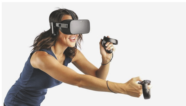
Rysunek 4. Gogle Oculus Rift