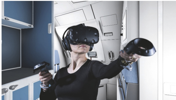
Rysunek 5. Szkolenia dla załóg przy użyciu symulatora VR

Źródło: http://www.adsadvance.co.uk/media/images/2017/EDM%27s%20VR%20Door%20Trainer.jpg , [dostęp: 13.09.2017 r.].