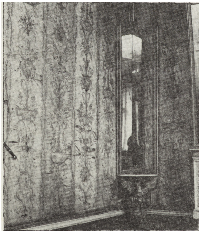
1. Salonik jedwabny w pałacu w Pawłowicach 1. Silk salon in the palace at Pawlowice

Jacek Królewski Centralne Muzeum Włókiennictwa w Łodzi Ewa Weigt Centralne Muzeum Włókiennictwa w Łodzi