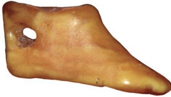
Ryc. 1. Bursztynowa zawieszka z Wolina, tzw. but Widara. Wg: Stanisławski 2012, 21 Fig. 1. "Vidar's shoe" amber pendant from Wolin. After: Stanisławski 2012, 21