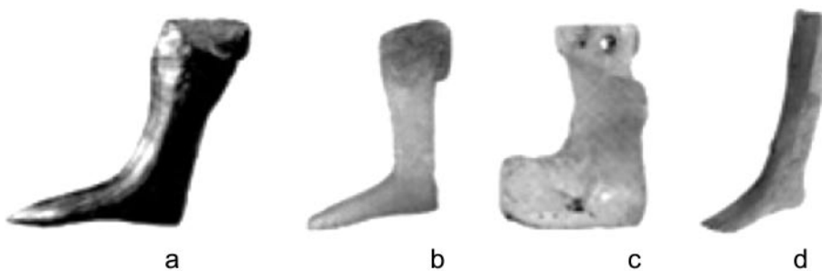
Ryc. 4. Miniaturowe buty/nogi/stopy ze Skandynawii: a – Kaupang; b i c – Hedeby; d – Björkö. Wg: Gardela 2014, 110, Fig. 3.51 Fig. 4. Miniature shoes/legs/feet from Scandinavia: a – Kaupang; b and c – Hedeby; d – Björkö. After: Gardela 2014, 110, Fig. 3.51