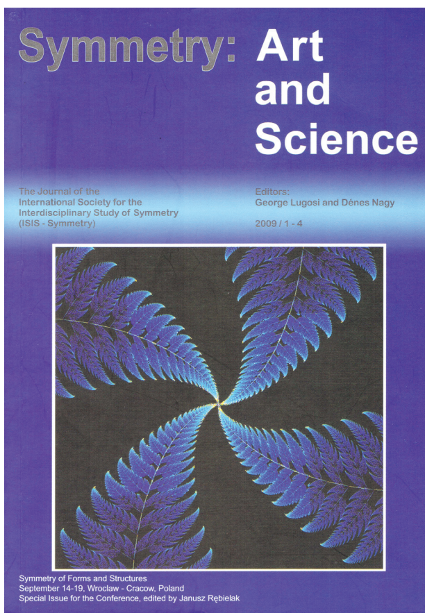
Il. 1. Okładka publikacji prezentującej materiały z konferencji „Symmetry of Forms and Structures”

Fig. 1. Cover of the publication containing conference proceedings of the “Symmetry of Forms and Structures”