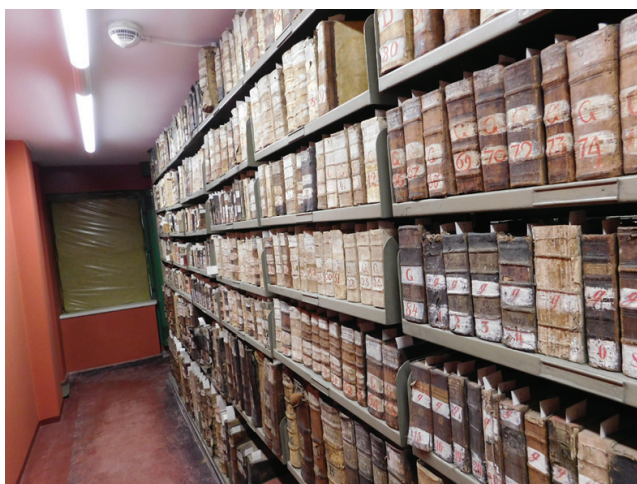
Il. 2. Księgozbiór braci reformatów w Bibliotece Jagiellońskiej