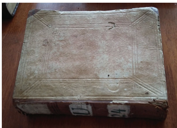
Il. 5. Oprawa z tektury ze skórzanymi wzmocnieniami grzbietu i narożnikami, fot. autor.