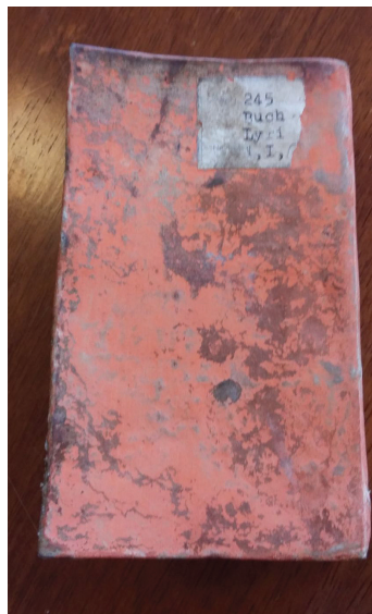
Il. 4. Oprawa pergaminowa barwiona na kolor czerwony, fot. autor.