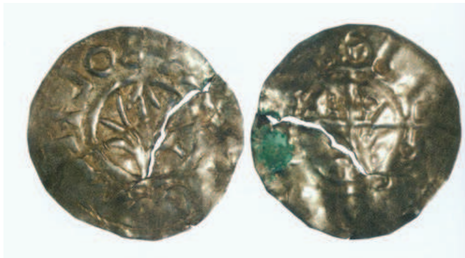
Ryc. 3. Denar Bolesława Chrobrego ze skarbu Kalisz-Rajsków, skala ok. 3:1; fot. A. Kędzierski, wg BOGUCKI, MIŁEK 2010 Fig. 3. Denar of Bolesław the Brave from the Kalisz-Rajsków hoard, scale ca. 3:1; photog. A. Kędzierski, after BOGUCKI, MIŁEK 2010