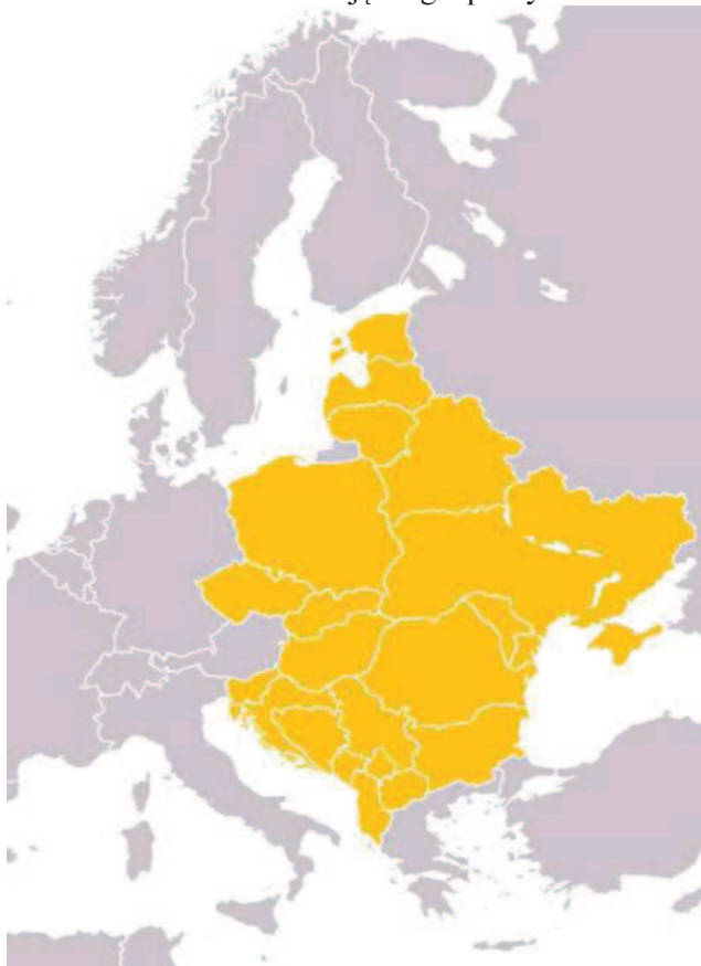
Rys. 2. Europa Środkowo-Wschodnia – ujęcie geopolityczne

Położenie państw Europy Środkowo-Wschodniej to położenie bez wątplenia między dwoma potęgami – Niemcami i Rosją – co już samo przez się wiele wyjaśnia 8 . Było ono przyczyną rozbiorów, walki o niepodległość, inkorporacji, zapóźnienia w rozwoju gospodarczym oraz następstw tego w formie: nacjonalizmu, mesjanizmu i kompleksów wobec Europy Zachodniej. Niemieckie „ Drang nach Osten ”, czyli „parcie na wschód” przenikało się w Europie Środkowo-Wschodniej z rosyjskim ekspansjonizmem i rozszerzaniem rewolucji. Ta część naszego kontynentu zawsze pełniła funkcję przedmurza wartości Wschodu i Zachodu bądź muru oddzielającego Wschód od Zachodu podczas zawirowań wojennych.