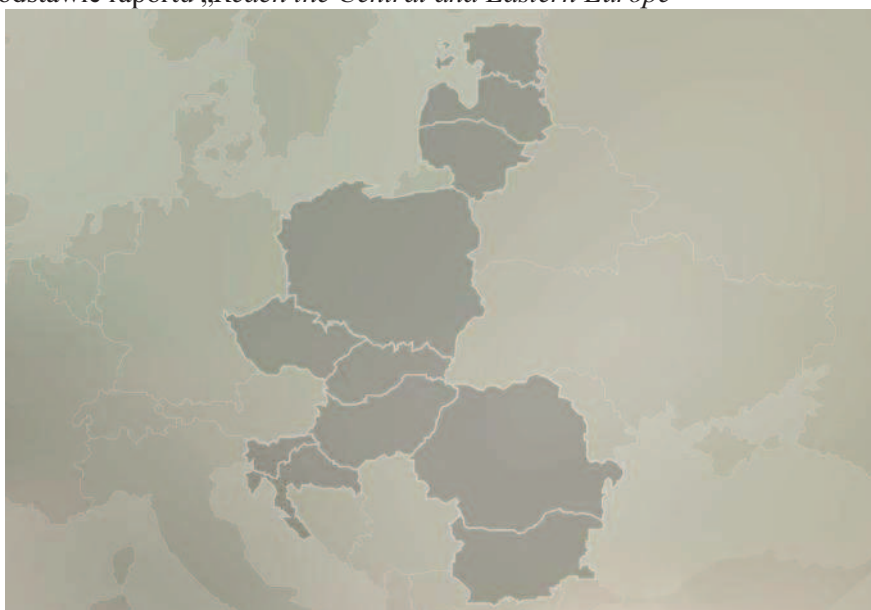
Rys. 1. Państwa Europy Środkowo-Wschodniej (EU 11), na podstawie raportu „ Reach the Central and Eastern Europe ”