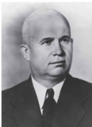
Zdj. 13. Nikita S. Chruszczow (1894–1971) (b.r.)