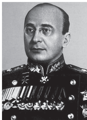
Zdj. 10. Ławrientij P. Beria (1899–1953) (b.r.)