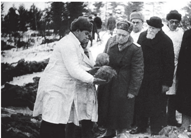
Zdj. 18. Kłamstwo sowieckie o Katyniu – styczeń 1944 r. komisja Nikołaja Burdenki ( Wybitni Żydzi... , b.r.)