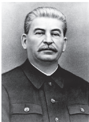
Zdj. 9. Józef W. Stalin (1878–1953) ( High Cadr , b.r.)