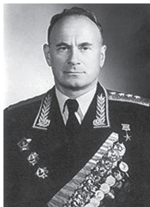
Zdj. 14. Iwan A. Sierow (1905–1990) (b.r.)