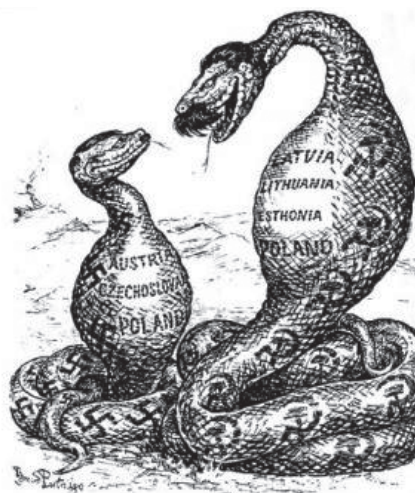
Zdj. 16. Satyra angielska z paktu Ribbentrop–Mołotow (początek września 1939 r.) (b.r.)