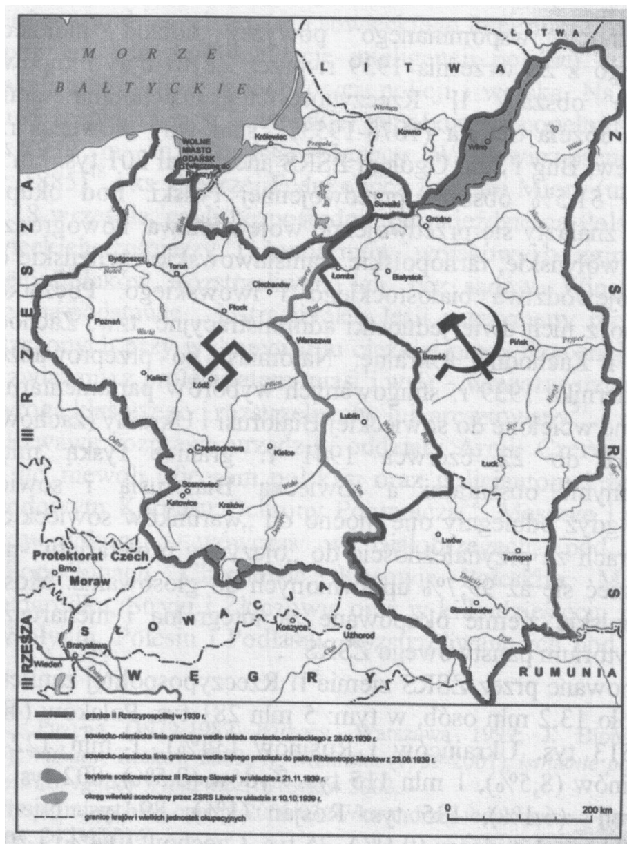
Mapa 3. Podział okupowanych ziem polskich w latach 1939–1941 między Trzecią Rzeszę i Związek Sowiecki