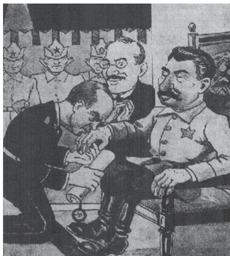
Zdj. 15. Tak satyryczna „Mucha” 8 września 1939 r. kpiła jeszcze z paktu Ribbentrop–Mołotow (Kwaśniewski, 2010, s. 203).