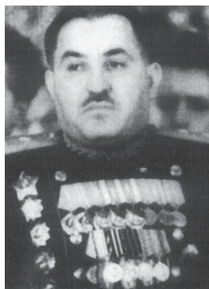
Zdj. 12. Ławrientij F. Canawa (1900–1955)