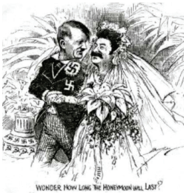
Zdj. 17. Satyra angielska z niemiecko-sowieckiego układu o granicach i przyjaźni z 28 września 1939 r. (b.r.).