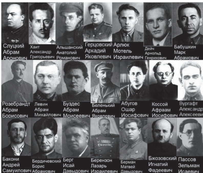
Zdj. 19. Kaci oficerów polskich internowanych w Związku Sowieckim (2015)