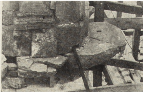
Ryc. 87. Jędrzejów — woj. kieleckie. Kościół pocysterski. Rozluźniona i popękana kamienna okładzina i gzyms między kondygnacjami wieży południowej.