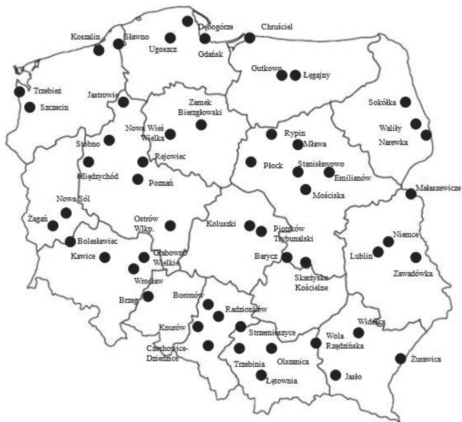
Rys. 2. Lokalizacja baz paliw w Polsce