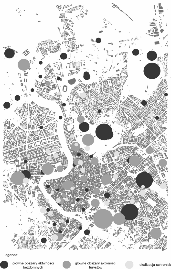
Rysunek 3. Mapa centrum miasta z zaznaczeniem głównych miejsc aktywności osób bezdomnych i turystów oraz lokalizacji ośrodków pomocowych.