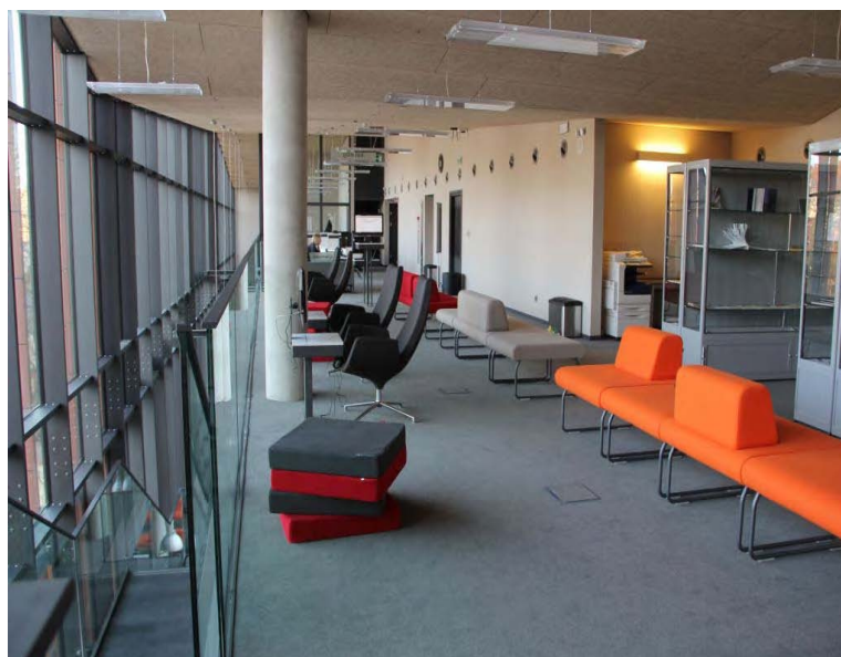
Zdj. 3. Arteteka.

Imponujący jest zbiór baz specjalistycznych z dziedziny sztuki i nauk pokrewnych, do których dostęp jest zapewniony wszystkim czytelnikom WBP w Krakowie. Bazy co prawda są anglojęzyczne, ale dają możliwość zapoznania się z tekstami dokumentów niedostępnymi w Polsce, także tymi wydawanymi poza Europą. Bazy multimedialne: Theatre In Vide , Dance In Video (Alexander Street Press) oraz International Bibliography of Theatre & Dance with Full Text (Ebsco), Music Library , Music Library Jazz .