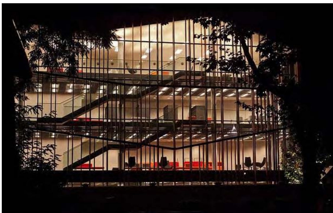
Zdj. 5. Arteteka nocą.

Aby sprostać wymaganiom współczesnego użytkownika i zapewnić jak największy komfort korzystania ze zbiorów, do dyspozycji użytkowników są 34 komputery typu all in one z dotykowymi ekranami (częściowo wyposażone m.in. w tablety graficzne), 60 czytników e-booków, 5 tabletów internetowych, zestaw PlayStation z kontrolerem ruchu PS Move, pianino cyfrowe, odtwarzacz Blue Ray, urządzenia wielofunkcyjne. Systematycznie Arteteka udostępnia nowy wysokiej jakości sprzęt wraz z profesjonalnym oprogramowaniem do tworzenia edycji, obróbki muzyki i grafiki. Arteteka Wojewódzkiej Biblioteki Publicznej w Krakowie w marcu 2013 r. uruchomiła kolejną usługę dla czytelników. 30 czytników e-booków, modele: (Kindle Touch, Kindle Classic, Onyx Boox x61e, Pocketbook Pro Touch 622, Pocketbook Pro 912)[9] można bezpłatnie wypożyczyć na okres dwóch tygodni, jedynie po podpisaniu stosownego oświadczenia. Kolejnych 30 e-czytników jest dostępnych na miejscu. W pamięci urządzeń znajdują się publikacje z domeny publicznej – np. z Wolnych Lektur . Istnieje też możliwość wgrania anglojęzycznych e-booków o sztuce, na które Arteteka posiada licencje.