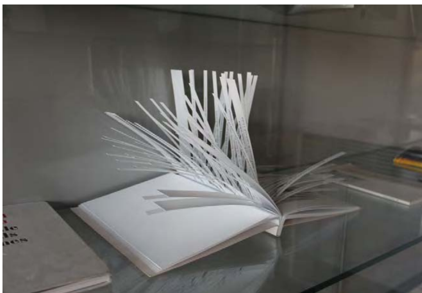
Zdj. 4. Raymond Queneau, Sto tysięcy miliardów wierszy .

dowolnie układać? Wojciech Kalaga w swoim artykule Liberatura: słowo, ikona, przestrzeń objaśnia nr 3 /2013 ISSN 2299-565X współdziałanie najistotniejszych elementów dzieła liberackiego. Litera, najmniejszy graficzny składnik słowa, jeszcze zanim z innymi literami utworzy morfem lub wyraz, usamodzielnia się w kreowaniu znaczeń. Rodzajem twórczości, który nam to uświadamia, jest poezja konkretna, w której litera jest nie tylko nośnikiem znaczenia, ale tworzywem tekstu wizualnego – „sememem” tekstobrazu. Litera jednak nie tylko potrafi być niezależna; potrafi także wspomagać znaczenia lub wskazywać ścieżki interpretacji[6].