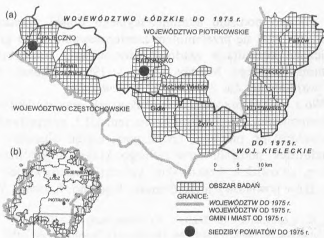
Rys. 1. Rejon radomszczański (a) na tle badanego obszaru (b)

Cele i metody badań oraz ogólna analiza całego obszaru oparta na materiałach empirycznych zaprezentowane zostały w opracowaniu pt. Delimitacja potencjalnego obszaru województwa łódzkiego . Studium wiedzy o regionie Łódzkim. Wyd. ŁTN (Koter, Liszewski, Suliborski, 1996).