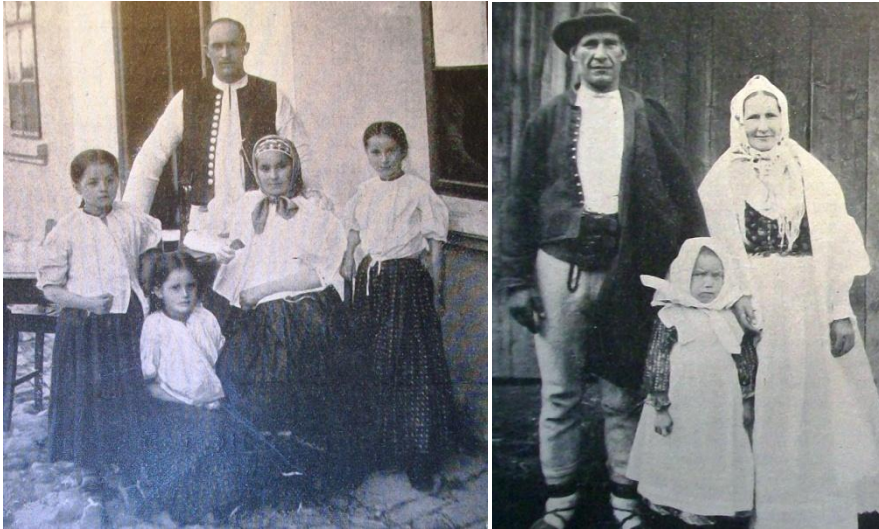
Fotografie Górali, zamieszczone w artykule S. Udzieli pt. „Etnograficzne ugrupowanie i rozgraniczenie rodów Górali polskich”. Górale śląscy z Istebnego (od lewej), Górale Beskidzcy z Krzyżowej (po prawej).