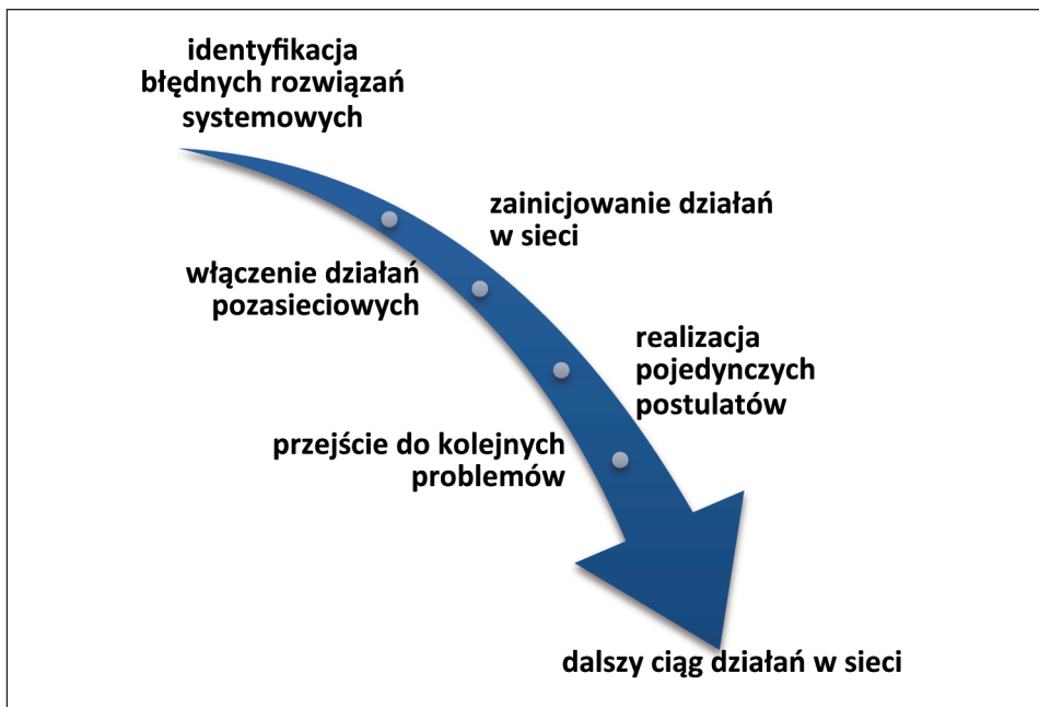
Rysunek 3. Dynamika działań ruchu „Obywatele Nauki”

sytuacji nauki i szkolnictwa wyższego w Polsce (naukowców, dziennikarzy, pracodawców, urzędników), ogłoszeń o konkursach, nagrodach, stypendiach, odkryciach. Mobilizacji środowiska służyć miały debaty, petycje, listy, ankiety, konsultacje.