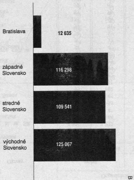
Nezamestnanosť v regiónoch k 30.09.1994