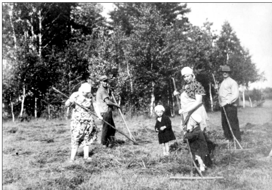
Ilustracja 5. Zbiór siana w latach 30. XX w. na uroczysku Jaroszówka

Wiktora Kozyrskiego znajdują się dwa spisy mieszkańców uroczyska Jaroszówka wykonane w 1891 i 1914 r. na potrzeby parafii prawosławnej w Wasilkowie 37 . W świetle zawartych w księgach metrykalnych informacji można odtworzyć członków rodziny Kozyrskich zamieszkujących w uroczysku.