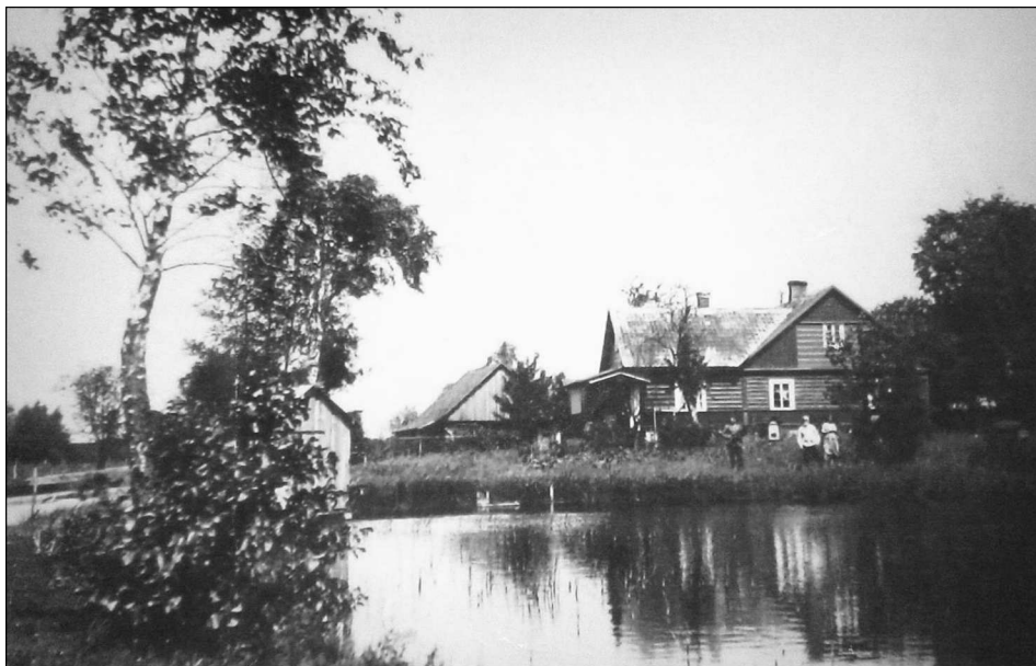
Ilustracja 4. Gospodarstwo Kozyrskich w Jarosłówce – stan na przełom lat 20. i 30. XX w.