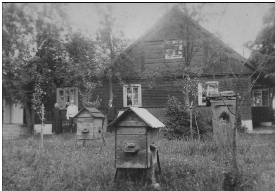
Ilustracja 8. Pasieka ulokowana przy domu mieszkalnym w Jaroszkówce (ok. 1926 r.)