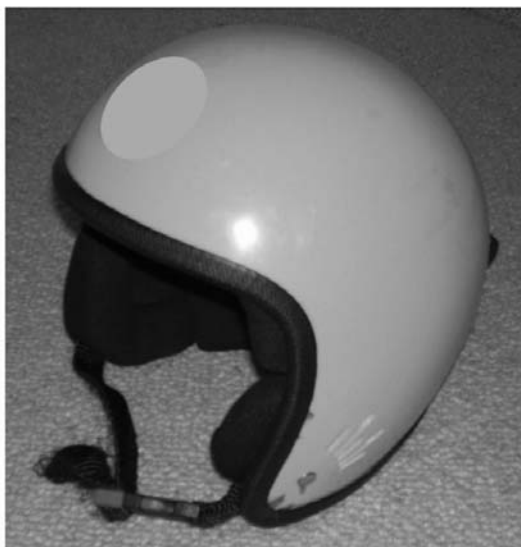
Fot. 1. Kask „twardy”, zasłaniający całe sklepienie czaszki i uszy