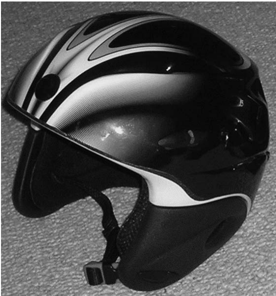
Fot. 2. Optymalny kask narciarski dla dziecka – chroniący sklepienie czaszki wraz z okolicą skroniową przy niewielkim ograniczeniu słyszalności

W piśmiennictwie dostępne są badania (w tym jedna metaanaliza), według których noszenie kasku narciarskiego nie wiąże się ze zwiększonym ryzykiem obrażeń odcinka szyjnego kręgosłupa [4,10,15,16]. Wyniki te odnoszą się również do dzieci poniżej 11. roku życia, jeśli użyto kasku we właściwym rozmiarze.