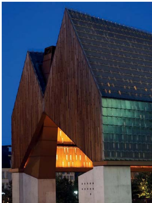
Fot. 17. Stadshal. Gandawa, 2019.