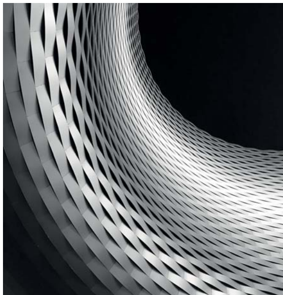
Fot. 4.a. II nagroda w Konkursie Fotograficznym, „Tęczówka”.