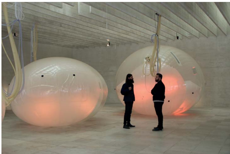
Fot. 13. Giardini di Biennale, Wenecja 2018.