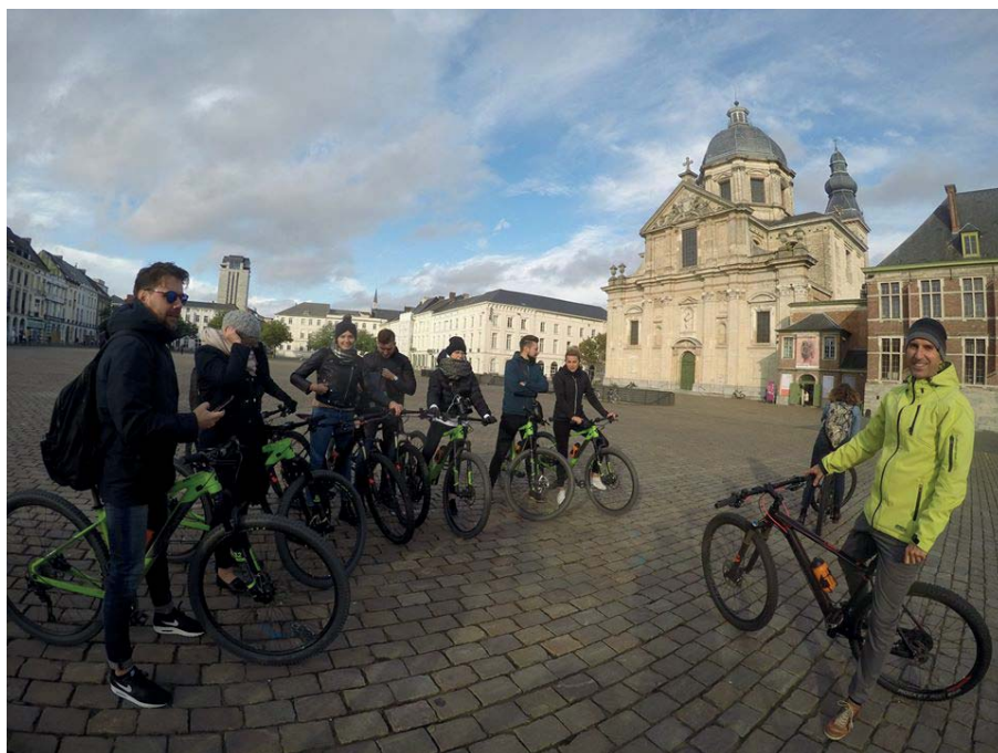
Fot. 16. Wycieczka rowerowa po Gandawie, 2019.