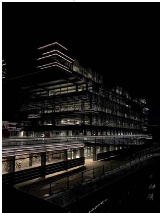
Fot. 18. De Krook, Biblioteka. Gandawa, 2019.