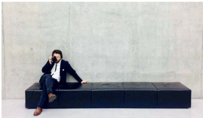
Fot. 6. Wyróżnienie w Konkursie Fotograficznym, „Solidne podparcie”.

Centrum sztuki Vitra w Weil am Rhein to miejsce kolejnej wyprawy Koła Naukowego, która miała miejsce w kwietniu 2018 roku (fot. 7, 8). Jej celem było zwiedzenie muzeum designu i pawilonów zaprojektowanych przez tuzów współczesnej architektury: Tadao Ando, Alvara Siza, Zahę Hadid, Franka Gehry’ego oraz Jacques’a Herzoga & Pierre’a de Meurona. Studenci mieli możliwość bezpośredniego obcowania z architekturą oraz wysłuchania wykładów zarówno na jej temat, jak i na temat wzornictwa. Odwiedzili również Bazyleę, która po raz kolejny zachwycała odważną architekturą nie tylko współczesną, ale także historyczną. Mimo napiętego harmonogramu znalazł się czas na obejrzenie obiektu autorstwa duetu Herzog & De Meuron – Museum der Kulturen 1 (fot. 9).