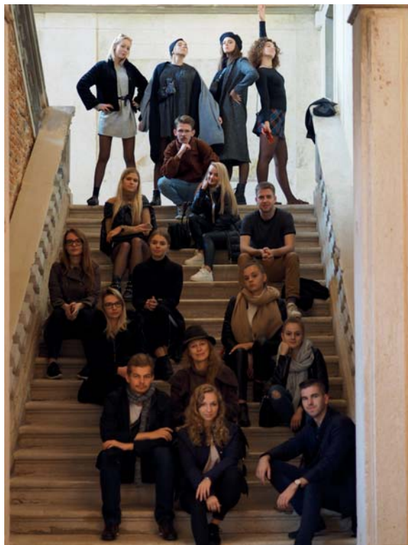
Fot. 11. Grupa studentów HAUZ07, Wenecja 2018.