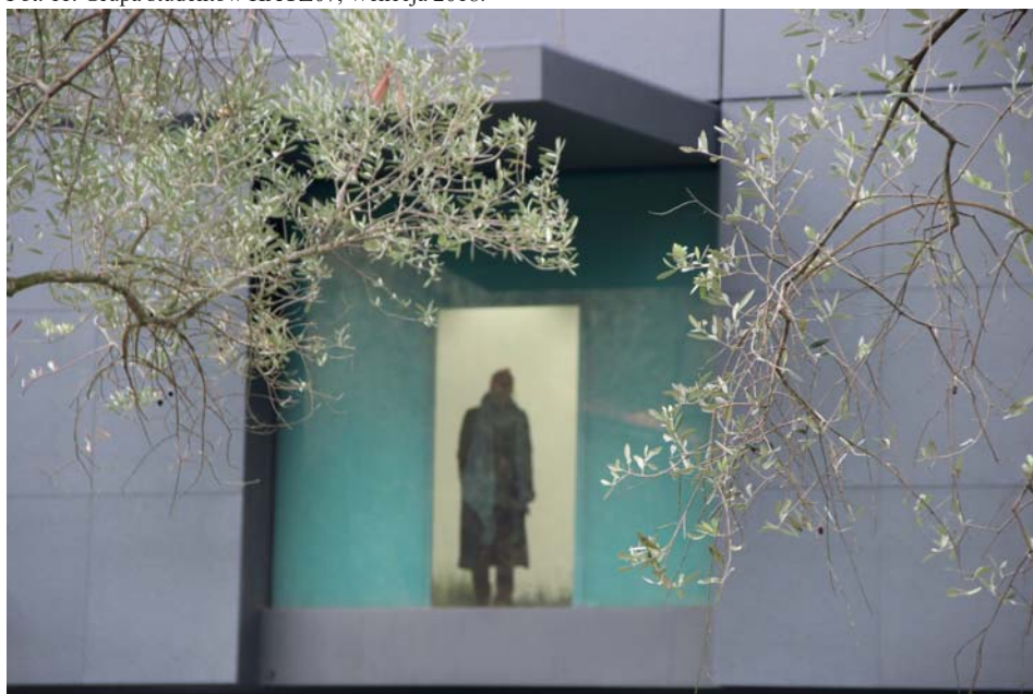
Fot. 12. Giardini di Biennale, Wenecja 2018.