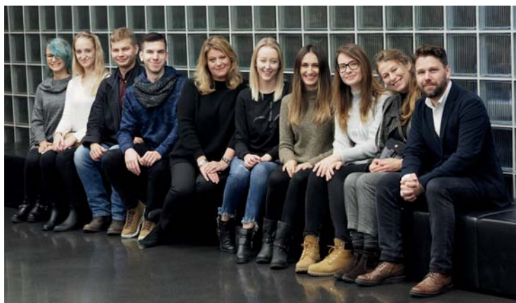
Fot. 2. Grupa studentów HAUZ07, Kunsthau Bregenz, Bregencja 2017.