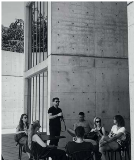
Fot. 7. Vitra Design Museum, Weil am Rhein 2018.

Centrum sztuki Vitra w Weil am Rhein to miejsce kolejnej wyprawy Koła Naukowego, która miała miejsce w kwietniu 2018 roku (fot. 7, 8). Jej celem było zwiedzenie muzeum designu i pawilonów zaprojektowanych przez tuzów współczesnej architektury: Tadao Ando, Alvara Siza, Zahę Hadid, Franka Gehry’ego oraz Jacques’a Herzoga & Pierre’a de Meurona. Studenci mieli możliwość bezpośredniego obcowania z architekturą oraz wysłuchania wykładów zarówno na jej temat, jak i na temat wzornictwa. Odwiedzili również Bazyleę, która po raz kolejny zachwycała odważną architekturą nie tylko współczesną, ale także historyczną. Mimo napiętego harmonogramu znalazł się czas na obejrzenie obiektu autorstwa duetu Herzog & De Meuron – Museum der Kulturen 1 (fot. 9).