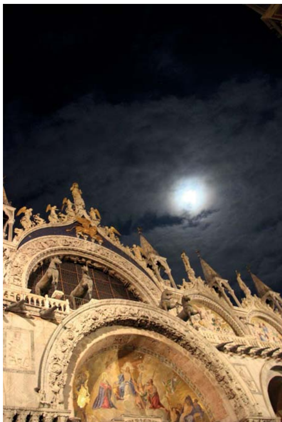
Fot. 10. Bazylika św. Marka, Wenecja, 2018.