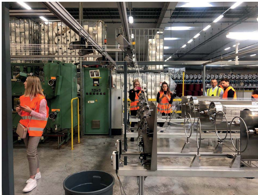
Fot. 15. Fabryka wykładzin dywanowych modulysy. Tielit 2019.