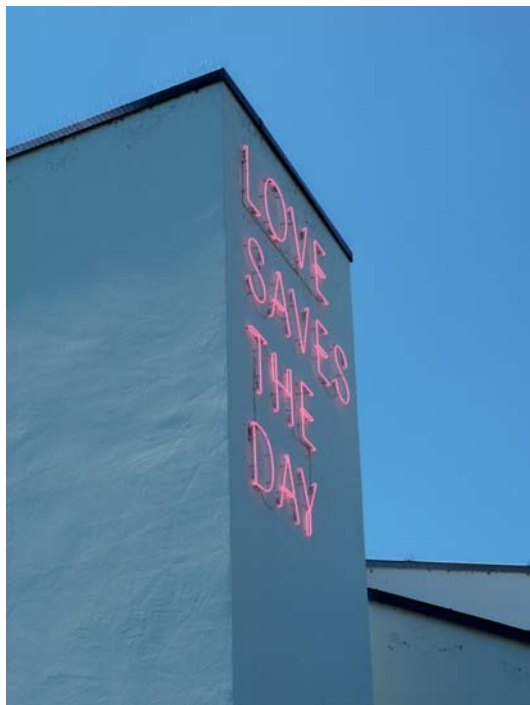
Fot. 8. Vitra Design Museum, Weil am Rhein 2018.