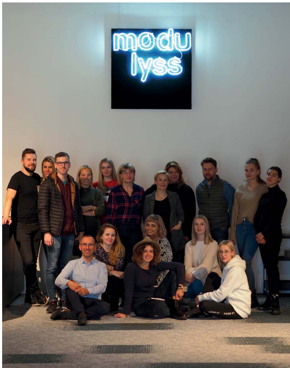
Fot. 14. Grupa studentów HAUZ07, Gandawa, Belgia 2019.