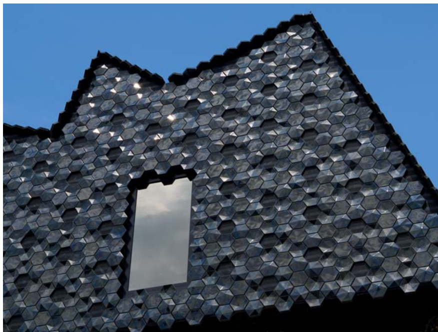
Fot. 9. Museum der Kulturen, Bazylea 2018.