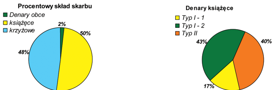
Ryc. 7. Skład ilościowy skarbu z Kopacza

krawędzie obustronnie uniesione, jednak nie tak wysoko jak na krzyżówkach, średnica ok. 12 mm.