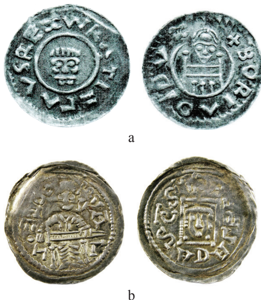
Ryc. 4. a. Czechy, Wratysłław II i Borzywoj II, denar morawski 1091–1092, 0,513 g, men. Ołomuniec (Videman, Paukert 2009, nr 54); b. Bolesław IV Kędzierzawy, denar, typ I, 1146–1152, men. Kraków, 0,523 g, ID N555

Na Śląsku proporcje udziału w rynku pieniężnym monet książęcych i denarów krzyżowych wyrównują się dopiero pod koniec XI w. wskutek uruchomienia od 1097 r. mennictwa Bolesława Krzywoustego jako księcia śląskiego. W depozycie z Kopacza 22 , odzwierciedlającym skład rynku z połowy pierwszej dekady XII w., proporcje te są dokładnie równe. Tereny złoto- i srebronośne Kopacza i Łośnia znalazły się w rękach Bolesława, który w ten sposób miał możliwość zapłacenia należnego trybutu.