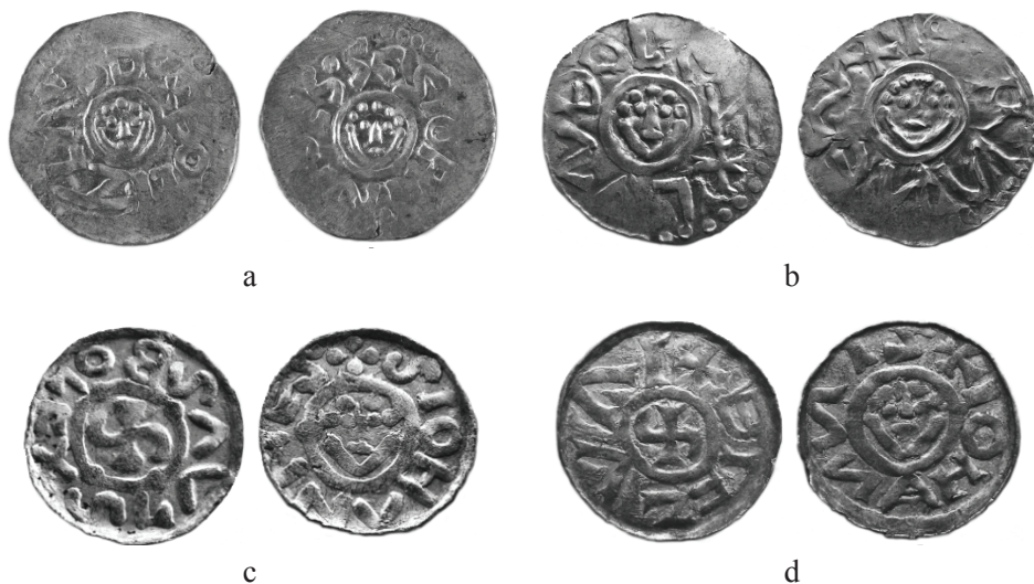
Ryc. 5. Bolesław III Krzywousty, denary śląskie, 1097–1107, FMP IV B, 2013, Taf. V–VI, 29/Kopacz, fot. autor: a. typ I-1, st. A-a, 0,793 g, nr 190, men. Legnica, Kopacz; b. typ I-2, st. P-o, 0,710 g, nr 557, men. Legnica, Kopacz; c. typ II, st. A-c, 0,860 g, nr 486, men. Wrocław, Kopacz; d. typ II, st. M-u, 0,820 g, nr 482, men. Wrocław, Kopacz

Cały 10-letni okres, począwszy od 1097 r. aż do zbrojnego rozstrzygnięcia sporu między braćmi na przełomie lat 1106/1107, sprzyjał emisjom monetarnym zarówno Zbigniewa (mennice w Poznaniu, Gnieźnie i Kaliszu), jak i Bolesława (w Legnicy i Wrocławiu). Mamy wówczas faktycznie do czynienia, szczególnie po śmierci księcia seniora Władysława Hermana, z dwoma, rywalizującymi ze sobą, niezależnymi organizmami państwowymi prowadzącymi własną, samodzielną politykę. W rezultacie tej rywalizacji Zbigniew został pokonany i w 1107 r. uznał zwierzchnictwo Bolesława, po czym otrzymał od niego Mazowsze w lenno.