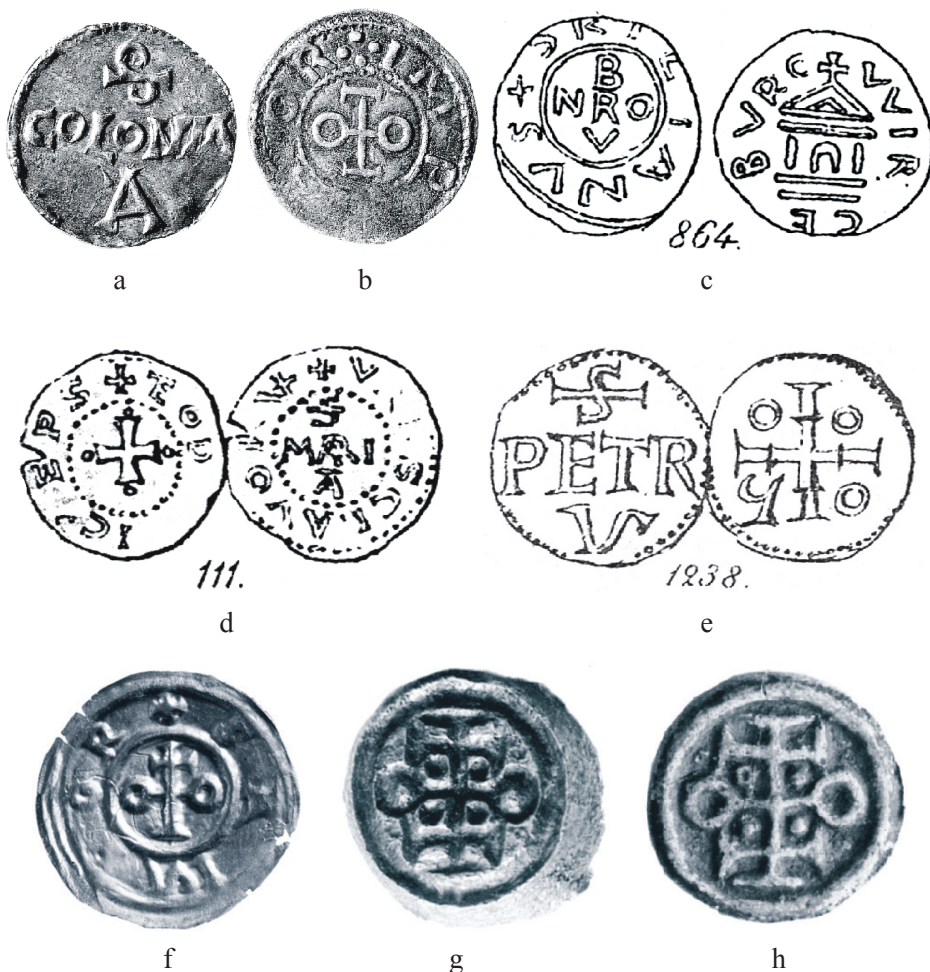
Ryc. 8. Przykłady napisów krzyżowych i monogramów na monetach.