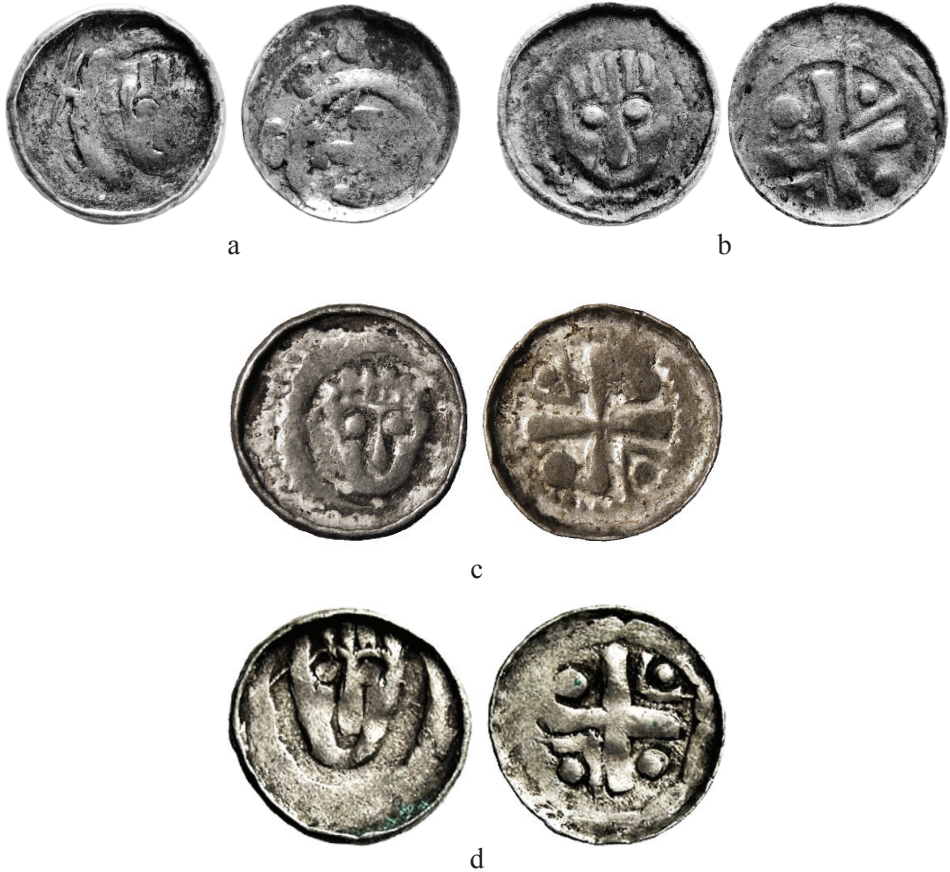
Ryc. 2. Wrocławskie denary krzyżowe typu VIII: a. denar, st. X-x, krzyż laskowany, 0,991 g, ID N1356; b. denar, st. E-d, krzyż prosty, 0,869 g, ID N1358; c. denar, st. A-b, krzyż prosty, 0,989 g, Fitzwilliam Museum Cambridge, d. denar, st. F-e, krzyż prosty, 0,814 g, PDA, aukcja 9:72