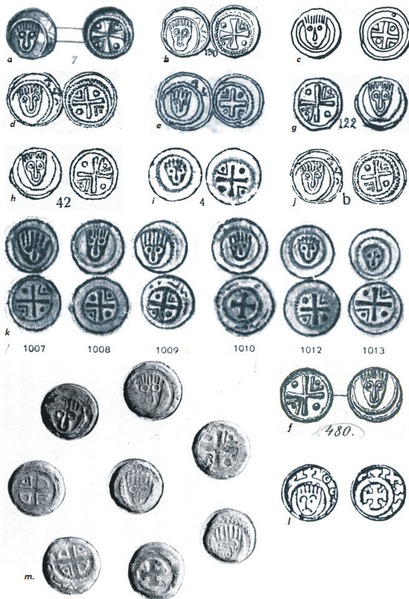
Ryc. 3. Wrocławskie denary krzyżowe typu VIII znane jedynie z literatury: a. Köhne 1849, s. 471, tabl. XIV:7; b. Lelewel 1851, tabl. 7: 130; c. Beyer, list 12510-1, Triller 1991, s. 83, ryc. 13; d. Stronczyński 1884, Typ 29, s. 52; e. Stronczyński 1884, tabl. IV: T29; f. Friedensburg 1887, Taf. X: 480; g. Gumowski 1904, WNA, tabl. IV: 122; h. Gumowski 1914, tabl. III: 42; i. Gumowski 1936, t. III, tabl. CXLV: 4; j. Gumowski 1936, t. III, s. 577, ryc. 56 b; k. Gumowski 1939, tabl. XXIX: 1007–1013; l. Friedensburg 1931, Taf. I: 6; m. Skarb, Drożyna (Druse), gm. Radwanice, fot. archiwalna 693 APWr., s. 231, FMP IV B, 13/Drożyna, 2013, Taf. XXXVIII: 13