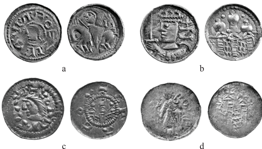
Ryc. 1. a–b. Bolesław II Szczodry, denary, men. Kraków: a. denar książęcy, ok. 1070–1076, 0,834 g, ID N509; b. denar królewski, 1076–1079, 0,814 g, ID N510. c. Władysław Herman, denar, men. Kraków, po 1079, 0,94 g, MNW 119562. d. Bolesław Krzywousty, denar krakowski typ I, men. Kraków, 1102–1107, 0,687 g, ID 1533

W następstwie najazdu księcia Brzetysława I w 1038 r. Śląsk został przyłączony do Czech. Kazimierz Odnowiciel w 1050 r. zbrojnie go odzyskał, co w 1054 r. zaakceptował cesarz, ustanowiwszy jednak daninę z tego tytułu na rzecz Czech w wysokości 500 grzywien srebra i 30 grzywien złota rocznie 2 . Konieczność płacenia Czechom wysokiego trybutu ze Śląska z pewnością była dodatkowym bodźcem dla Bolesława do uruchomienia własnego mennictwa.