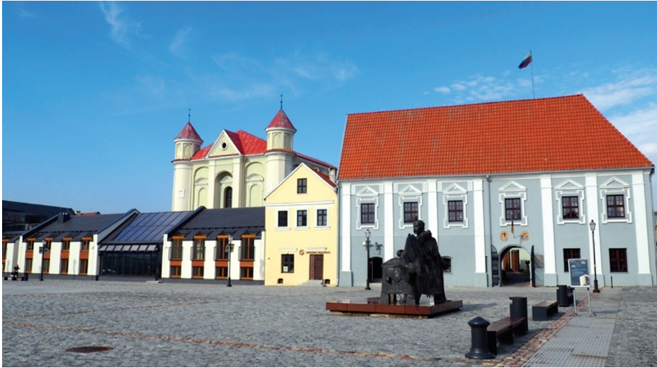
1. Na pierwszym planie na tle ratusza aż nazbyt okazały, współczesny pomnik Janusza Radziwiłła. Z tyłu po lewej fragment bryły dawnego zboru kalwińskiego – obecnie Mauzoleum Radziwiłłów