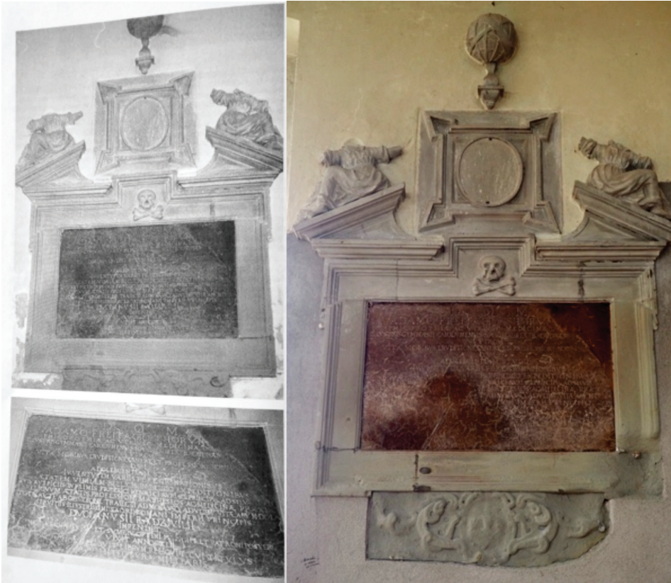
5. Dawniejszy i obecny stan epitafium Adama Freytaga

Tekst inskrypcji w możliwie wiernym przekładzie: