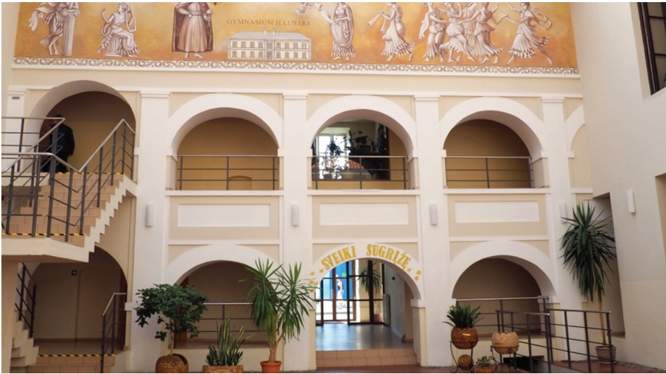
3. Fragment wewnętrznego dziedzińca (atrium) obecnego kiejdańskiego gymnasium illustre