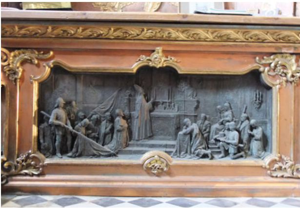
7. Kościół Jezuitów we Lwowie, antependium ołtarza Matki Boskiej Pocieszenia, projekt Antoniego Popiela. Fot. A. Betlej 2011