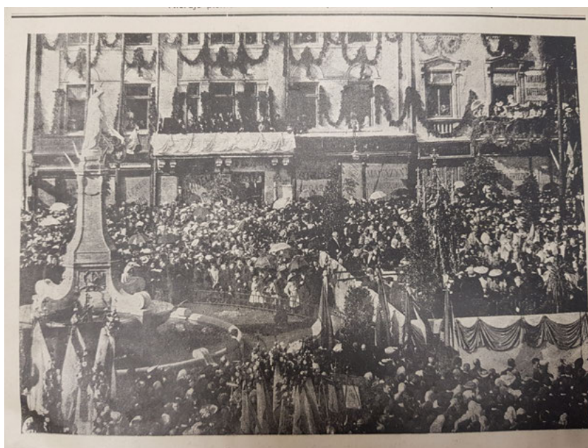
2. Uroczystości koronacyjne w kościele Jezuitów we Lwowie w 1905 r., w: „Kronika w Obrazach”, R. 1, 1905 z. 8 (3 czerwca)