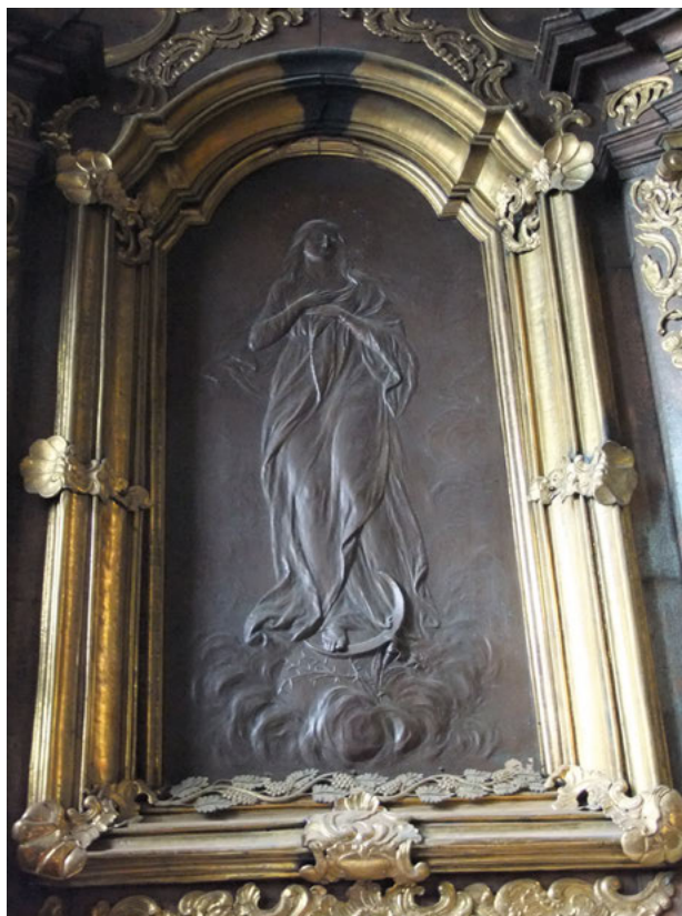
6. Płaskorzeźba Matka Boska Niepokalana – zaszuwa na obrazie Matki Boskiej Pocieszenia, wykonał Piotr Wójtowicz. Fot. A. Betlej 2011

ogłoszenie uroczystej nowenny w dniach 19–27 maja, z trzykrotnym wystawieniem Najświętszego Sakramentu i kazaniami 14 .