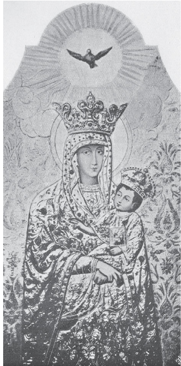
4. Obraz Matki Boskiej Pocieszenia, fotografia sprzed 1939, Kraków, Archiwum Prowincji Polski Południowej Towarzystwa Jezusowego

W lutym 1905 r. zwrócono się do kapituły watykańskiej o pozwolenie na koronację, petycję podpisał episkopat galicyjski trzech obrządków, najwyżsi urzędnicy z namiestnikiem i marszałkiem krajowym, posłowie do rady państwa i sejmu, burmistrz lwowski z magistratem i radą. 12 lutego wydano w Rzymie dekret koronacyjny, a arcybiskupowi Bilczewskiemu zlecono dokonanie aktu Koronacji. W „Kurendzie” archidiecezji lwowskiej z 28 kwietnia 1905 r. ogłoszono dekret uznający „starożytność” i cudowność obrazu i wyznaczono uroczystość na dzień 28 maja 13 .