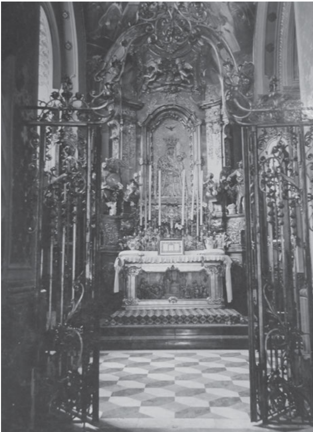
3. Kościół Jezuitów we Lwowie, ołtarz w kaplicy Matki Boskiej Pocieszenia, fotografia sprzed 1939, Kraków, Archiwum Prowincji Polski Południowej Towarzystwa Jezusowego