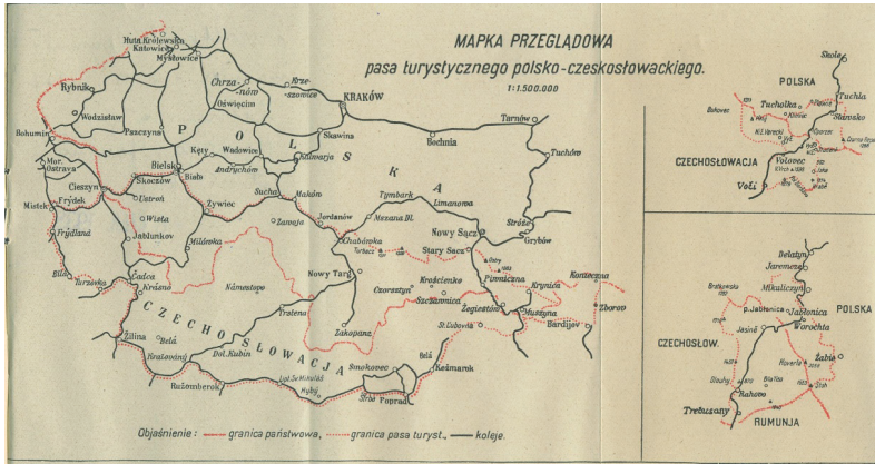
Mapa 1. Obszar polsko-czechosłowackiej konwencji turystycznej z 1925 roku