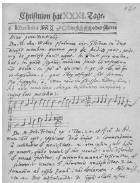
Il. 2. BUWr, Oddział Rękopisów, R 2347, fol. 171r (4 XII 1648)

chorałowej 96 , w innym zaś zamieścił w kalendarzu nuty pieśni śpiewanej zamiast zwyczajowej Wenn wir in höchsten Nöten sein :