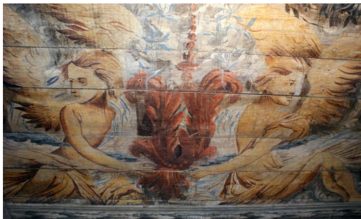
Il. 2. Warsztat Johanna Tiedemana młodszego (atryb.), Para aniołów , fragment dekoracji stropu sieni w kamienicy przy ul. Żeglarskiej 16 w Toruniu, 1702.