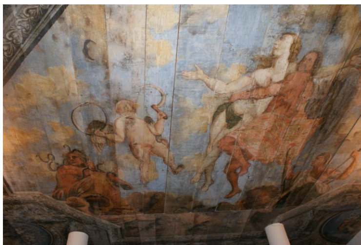
Il. 3. Warsztat Johanna Tiedemana młodszego (atryb.), Prawda córką Czasu , fragment dekoracji stropu sieni w kamienicy przy ul. Żeglarskiej 16 w Toruniu, 1702.