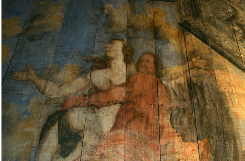
Il. 4. Warsztat Johanna Tiedemana młodszego (atryb.), Chronos unoszący Prawdę , fragment dekoracji stropu sieni w kamienicy przy ul. Żeglarskiej 16 w Toruniu, 1702.

włosach, trzymająca w dłoni własne serce, którym się posila 6 . Druga z postaci, Niezgoda, trzyma w lewej ręce sztylet skierowany ostrzem we własną pierś, a w prawej dłoni płonąca pochodnię (il. 5) 7 .