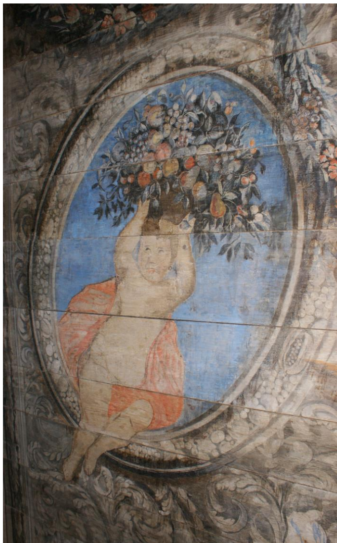
Il. 1. Warsztat Johanna Tiedemana młodszego (atryb.), Putto z koszem , fragment dekoracji stropu sieni w kamienicy przy ul. Żeglarskiej 16 w Toruniu, 1702.