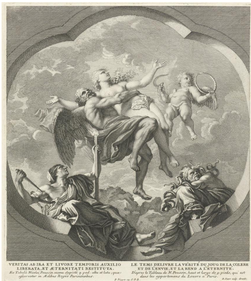
Il. 6. Bernard Picard na podstawie Nicolasa Poussina, Prawda córka Czasu, miedzioryt/akwaforta, Paryż, 1692-1696.