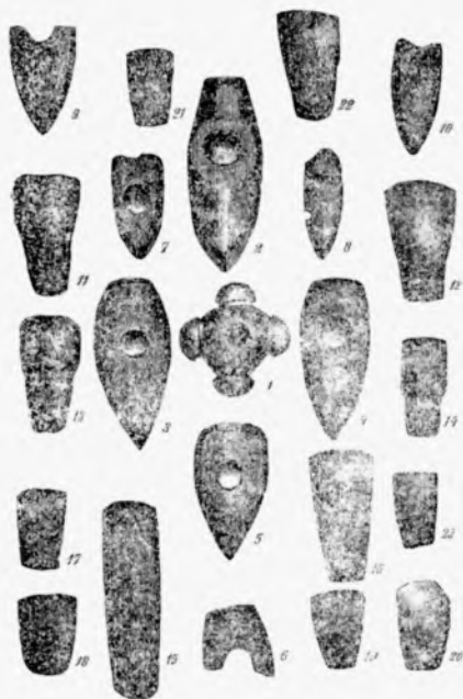
Ryc. 2. Narzędzia kamienne omawiane przez Kuścińskiego na zjeździe (wg Kuścińskij 1871)