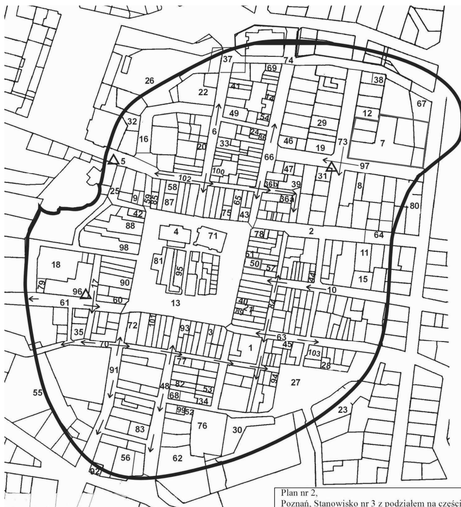
Plan nr 2, Poznań, Stanowisko nr 3 z podziałem na części.

Omówiony w niniejszej pracy materiał archeologiczny reprezentowany jest przez różnego rodzaju przedmioty szklane, a wśród nich zarówno wyroby luksusowe, jak i codziennego użytku. Większość z nich zachowana jest fragmentarycznie, a jedynie 3 naczynia zachowane są w całości (2 ampułki i fiolka). Najwięcej zachowanych jest części przydennych i górnych naczyń. Z nich wyodrębniono materiał, który poddano częściowej lub niekiedy całkowitej rekonstrukcji, wykorzystując analogie do egzemplarzy pozyskanych z innych wykopalisk. Największą grupę naczyń zrekonstruowanych częściowo stanowią szklanice, szklanki, kieliszki, butelki duże i butelki małe. W trakcie analizy wyrobów szklanych wyodrębniono także fragmenty środkowych części naczyń.