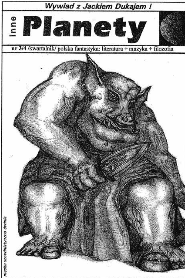
Ryc. 1. „Inne Planety”, fanzin Klubu Fantastyki „Druga Era” działającego przy Akademii Ekonomicznej w Poznaniu, 1999, rys. na okładce Stach Sadowski.

niekomercyjne hobbystyczne pismo, najczęściej wydawane w małym nakładzie (100-200 egzemplarzy) w prostej szacie graficznej przez grupkę zapaleńców, nierozpowszechniane przez normalną dystrybucję i najczęściej pojawiające się nieregularnie. Zwykle ową grupkę stanowią członkowie klubów fantastyki, ale oczywiście robić to może każdy – wystarczy zapal, zestaw tekstów i, niestety, przynajmniej kilkaset złotych na opłacenie druku. Fanziny można zakupić przeważnie na