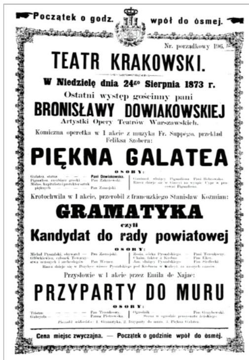
Fot. 4. Zapowiedź występu Dowiakowskiej w operetce Piękna Galatea .

loraturę. Zachwycał się lekkością wykonania najtrudniejszych pasaży akordowych, gam, tryli, które śpiewaczka pokonywała „bez najmniejszego natężenia, a nawet z pewną kokieterią i dystynkcją” 30 .