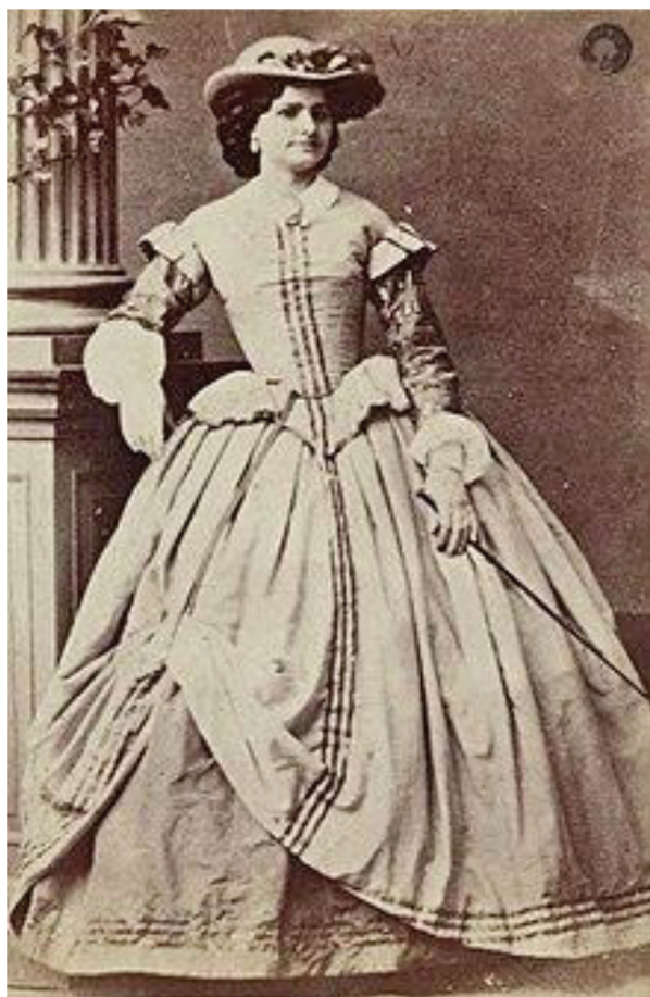
Fot. 1. Bronisława Dowiakowska w kostiumie do partii tytułowej opery Stanisława Moniuszki Hrabina , fot. Konrad Brandel, ok. 1866 r.

Źródło: https://polona.pl/item/dowiakowska-bronisława