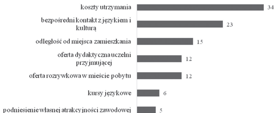
Wykres 2. Czynniki decydujące o miejscu wyjazdu w opinii studentów

jest również w poszczególnych grupach narodowościowych – 32% (23 osoby) dla studentów polskich i 31% (11 osób) dla studentów czeskich; bezpośredni kontakt z językiem i kulturą kraju przyjmującego był najważniejszym czynnikiem przy wyborze kraju wyjazdu dla 23 osób ogółem (15 osób – 22% studenci polscy; 8 osób – 21% studenci czescy), mniej ważna dla wszystkich studentów okazała się odległość uczelni przyjmującej od miejsca zamieszkania oraz jej oferta dydaktyczna wraz z ofertą rozrywkową w mieście pobytu.