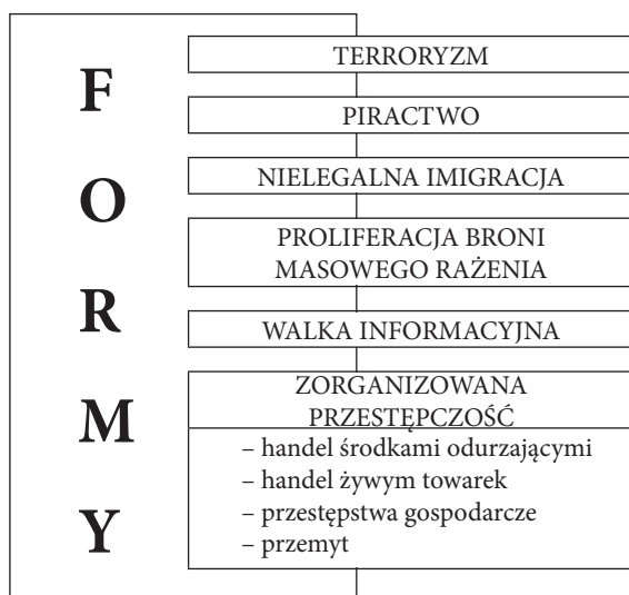
Rycina 2. Formy zagrożeń asymetrycznych na morzu