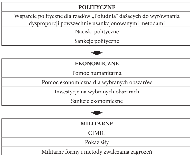
Rycina 3. Etapy zapobiegania i zwalczania zagrożeń asymetrycznych

Źródło: K. Rokiciński, Wybrane aspekty zagrożeń asymetrycznych na morzu w funkcji wykorzystania sił morskich , „Zeszyty Naukowe Akademii Marynarki Wojennej” 2005, s. 167.