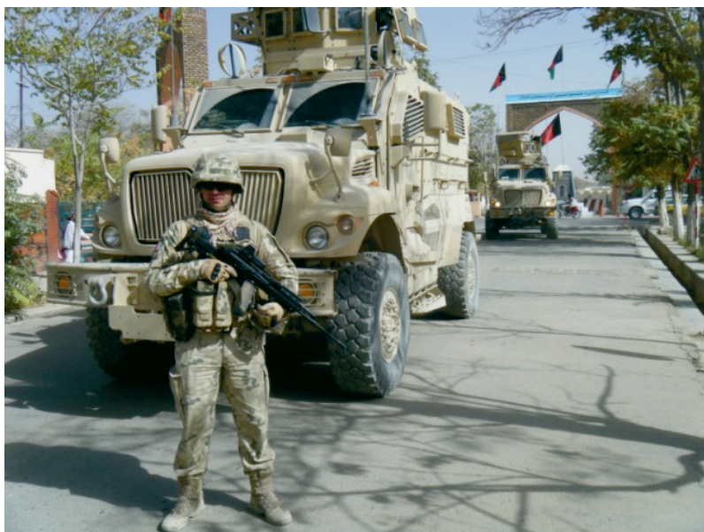
Fotografia 1. Pojazd o zwiększonej odporności na improwizowane ładunki wybuchowe typu MRAP użytkowany przez PKW w Afganistanie na podstawie umowy ACSA*