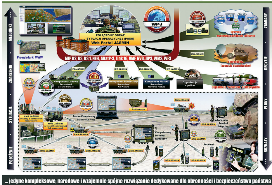
Rysunek 2. Schemat Sieciocentrycznej Platformy Teleinformatycznej (SPT) C4ISR* JAŚMIN

* C4ISR – Command, Control, Communications, Computers, Intelligence, Surveillance and Reconnaissance. Por. AAP-6 (2014) PL – Słownik terminów i definicji NATO.