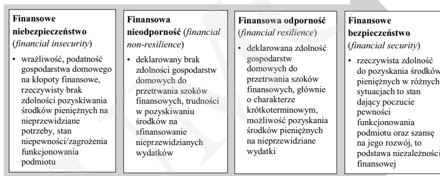
Rys. 1. Miejsce odporności finansowej w procesie kształtowania finansowej niezależności gospodarstwa domowego

wania podmiotu, jak i szansę na jego rozwój (rys. 1). Stanowi ona rezultat właściwego zarządzania ryzykiem codzienności, które objawia się m.in. jako ryzyko wpadnięcia w tzw. pułapkę losu, czyli doświadczenie pewnych nieprzewidywanych zdarzeń, pozbawiających ludzi zasobów majątkowych, przejawiających się doznaniem szoku dochodowego wywołanego nagłą utratą narzędzia do zarobkowania, zwolnieniem z pracy, gwałtowną utratą zdrowia itp. [Solarz, 2012, s. 72]. Urzeczywistnienie się ryzyka finansowego codzienności może skutkować poważnymi problemami dotyczącymi budżetu domowego, a czasami może prowadzić do nadmiernego zadłużenia czy nawet wykluczenia finansowego ( financial exclusion ).