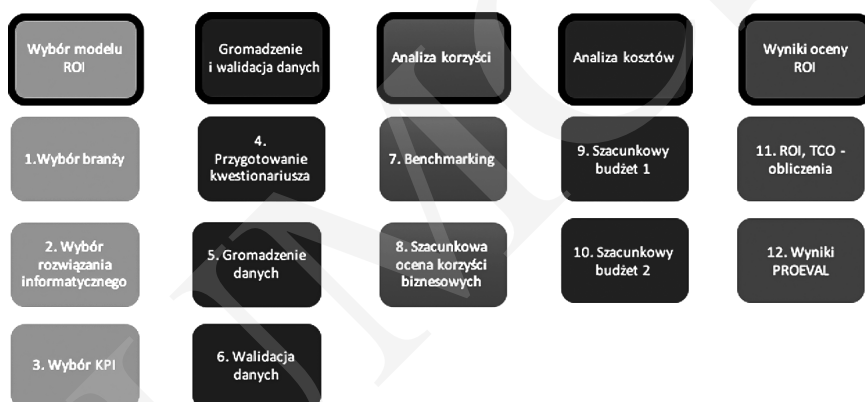
Rys. 3. Szczegółowy proces oceny PROEVAL