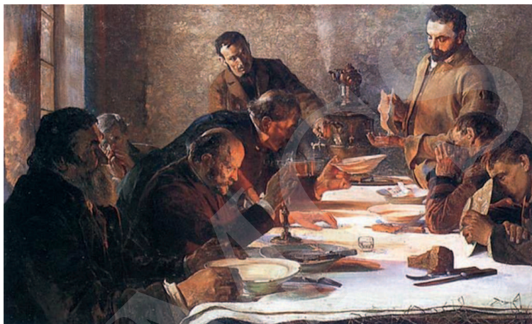
Ilustracja 1. J. Malczewski, Wigilia na Syberii , 1892, wymiary: 81cm x 126cm.

Ten narodowy, fundamentalny dla sztuki Malczewskiego aspekt widzimy również w cyklu obrazów związanych z Syberią – Na etapie. Sybiracy (1890), Sybiracy (1891) i Wigilia na Syberii (1892) 15 . Ostatni z nich zainspiruje Kaczmarskiego.