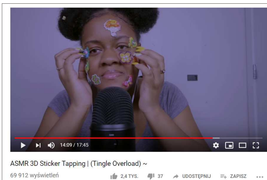
Ryc. 3. Dźwięki niewerbalne. Stukanie w naklejki ( face stickers ).

Ponieważ wiele z tych czynności wywołuje różne dźwięki w zależności od obiektu, na którym są wykonywane, osobną kategorię stanowią tzw. przedmioty ASMR. Na przykład, jeżeli nagranie poświęcone jest odgłosom stukania, opukiwania, artysta próbuje zróżnicować dźwięki nie tylko poprzez tempo i natężenie dźwięku, ale także poprzez dobór przedmiotów, w które stuka. Mogą to być pudeleczka, opakowania, buteleczki z płynem, przedmioty metalowe, drewniane, itp. Niektóre artystki stukają we własne zęby (np. Chynaunique ASMR „ASMR Teeth Tapping” 28 ), paznokciami o paznokcie/tipsami o tipsy (np. ASMR blossom „ASMR – Tapping on Nails [Most Underrated Trigger]” 29 ), a jedna z artystek przykleja specjalne naklejki 3D na twarz i relaksuje odbiorców stukaniem w owe naklejki ( Batala’s ASMR „ASMR 3D Sticker Tapping | (Tingle Overload) ~” 30 ; Ryc. 3)