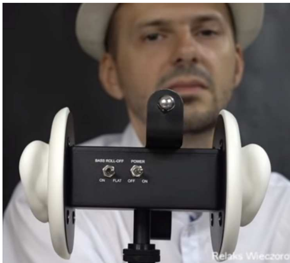
Ryc. 2. Mikrofon binauralny z nakładkami w kształcie ucha 26 .