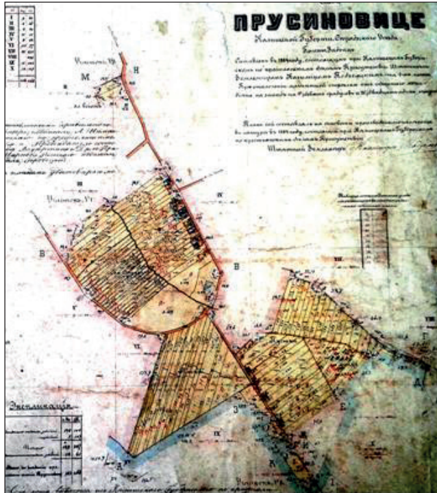
Ryc. 4. Plan gruntów przechodzących na własność włościan wsi Prusinowice z 1884 r. (układ poparcelacyjny rzędówek i osad wtórnie rozproszonych)

stanowi już dziś autonomicznych w sensie administracyjnym jednostek przestrzennych. W centrum układu zachowała się natomiast dobrze struktura dawnego założenia dworsko-folwarcznego, której nadal towarzyszy czytelny układ blokowy rozłógów o charakterze poseparacyjnym.