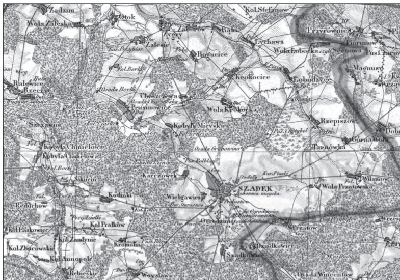
Ryc. 2. Topograficzeskaja Karta Carstwa Polskago , 1839–[1843], 1:126 000, Kol. II Sek. V oraz Kol. II Sek. III, Centralna Biblioteka Geografii i Ochrony Środowiska Instytutu Geografii i Przestrzennego Zagospodarowania PAN, sygn. C.542

Kwestie rozwoju osadnictwa wiejskiego odnoszące się ściśle do omawianego obszaru stanowiły do tej pory przedmiot rozważań niewielu opracowań naukowych. Wskazać można jedynie pojedyncze prace podejmujące w ujęciu historycznym problematykę prawnowłasnościową, ludnościową lub ekonomiczną wsi 9 , choć na ogół zagadnienie to ujmowane było w dużo szerszej perspektywie przestrzennej 10 . Brak jest natomiast zupełnie prac dotyczących zróżnicowania morfoge-