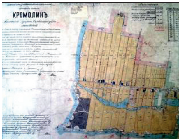
Ryc. 6. Plan gruntów włościan wsi Kromolin z 1886 r. (rzędówka poregulacyjna)

Kobyła Chmielowa jest natomiast wsią położoną na zachód od Szadku. Rejestry poborowe z XVI w. wskazują na dużą dynamikę areалу chłopskiego: od 1,5 do 2,5 łąnów przy 9 osadnikach w 1552 r. (tabl. 1). Na początku XIX w. odnotowano tu 20 domów zamieszkałych przez 171 osób (tabl. 2). Analiza najstarszych map topograficznych do połowy XIX w. daje podstawę, by stwierdzić, że mamy do czynienia z dużą wsią drogową, ze zwartą zabudową po obu stronach drogi równoległej do biegu cieków Brodnia (ryc. 1 i 2). Według danych Towarzystwa Kredytowego Ziemskiego z lat 80. XIX w. folwark obejmował 1111 morgów ziemi, rozmierzono 7 zagród, a włościanie otrzymali w posiadanie 68 morgów. Poregulacyjny układ wsi miał charakter obustronnie zabudowanej rzędówki. Stanowiła ona jedną całość z położoną na południe wsią Boczki, z którą wchodziła w skład jednego kompleksu majątkowego. Jednocześnie na zachód od Kobyli Chmielowej wytyczono nową osadę w postaci rzędówki na osi wschód-zachód, z jednostronną zabudową po południowej stronie drogi i pasmowymi nadziałami gruntowymi (zob. ryc. 1 i 2 w nast. art.). W okresie powstania wieś o nazwie Boczki Kabyłskie (obecnie Boczki Nowe) obejmowała 11 zagród z gruntami liczącymi łącznie 92 morgi 40 .