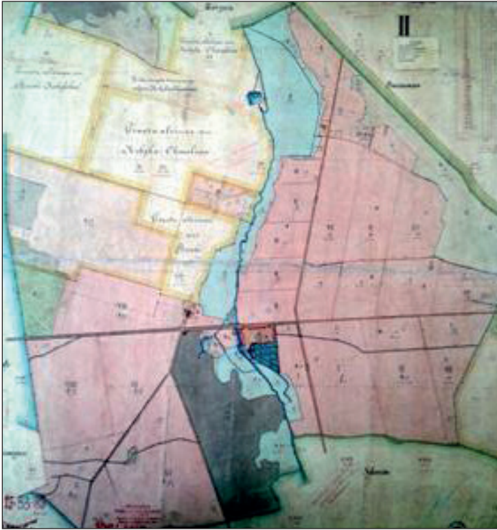
Ryc. 7. Plan majątku Boczki z lat 80. XIX w. (folwark sprzężony z obustronnie zabudowaną osadą poregulacyjną)

Nie odnaleziono w wyniku przeprowadzonej kwerendy danych źródłowych, które wskazywałyby na wczesną metrykę historyczną wsi Reduchów (dawniej Raduchów). Pierwsze potwierdzone wzmianki na temat tej miejscowości odnaleźć można z całą pewnością dopiero w rejestrach poborowych oraz aktach wizytacyjnych z początku XVI w., gdzie potwierdzić można liczbę łąnów chłopskich oraz informację o szlacheckim statusie własnościowym 51 . W połowie XVI w. rejestry poborowe wskazują obecność 10 osadników, choć areal chłopski w tym okresie był bardzo zmienny i wahał się od 3 do 6 łąnów (tabl. 1). W latach 20. XIX w. wykazano 8 domów oraz 64 mieszkańców (tabl. 2). Analiza historycznych map topograficznych daje podstawę, by twierdzić, że miejscowość wykazywała układ niezbyt regularnej wsi drogowej, obustronnie zabudowanej. Zamknięcie osi kom-