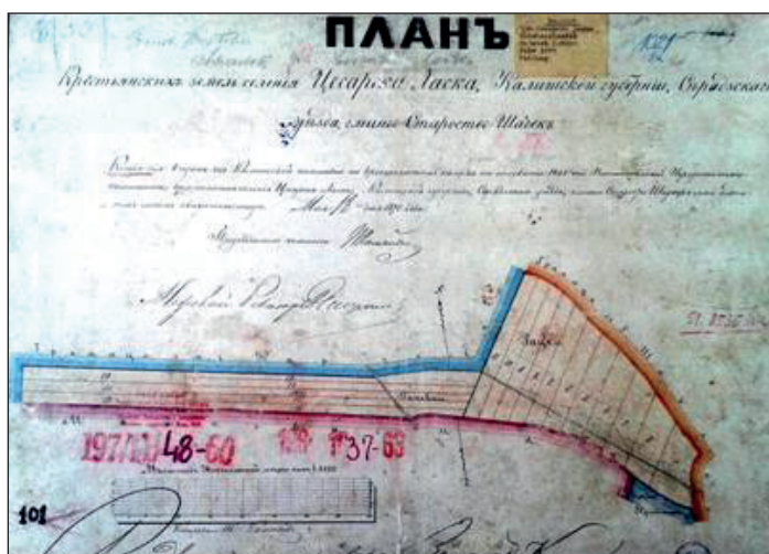
Ryc. 3. Plan gruntów wsi Cesarska Łaska z 1870 r. (kolonia poparcelacyjna)

danych ilościowych na temat wielkości wsi w rejestrach poborowych z XVI w. oprócz wzmianki na temat 3 osadników (tabl. 1). W spisie wykonanym w 1827 r. wykazano wykorzystanie tylko jednego domu mieszkalnego (tabl. 2). Na mapie Gilly'ego z końca XVIII w. oraz mapie Kwatermistrzostwa z I połowy XIX w. wieś miała formę niewielkiego przysiółka drogowego (ryc. 1 i 2). W II połowie XIX w. doszło do procesów regulacyjnych, które doprowadziły do całkowitej dekompozycji dawnego siedliska. Przyjęło ono formę układu rozproszonego w postaci nieregularnie usytuowanych zagród w obrębie nowo rozmierzonych rozłogów (zob. ryc. 1 w nast. art.). Na wschód od Karczówka, w kierunku Szadku, po ukazie uwłaszczeniowym, z terenów wykrojonych z innych osad ukształtowana została mała wieś o charakterze kolonijnym: Cesarska Łaska (ryc. 3). Nazwa wymyślona została przez rosyjskich komisarzy, a wieś została nadana za zasługi włościanom, urzędnikom lub wojskowym. Po odzyskaniu niepodległości, Rozporządzeniem Ministra Spraw Wewnętrznych z 7 IV 1925 r. dawną nazwę zmieniono na Dziezwulin. Z czasem niewielka kolonia stała się formalnie częścią Karczówka.