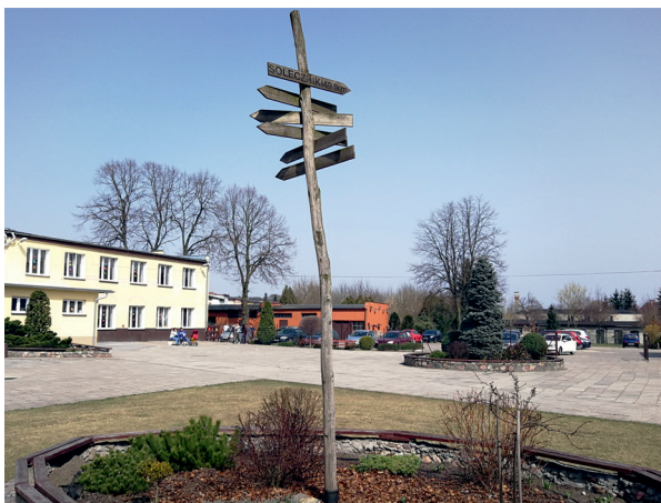
Fot. 1. Kierunkowskaz miast i regionów współpracujących z Nowym Miastem Lubawskim zlokalizowany na terenie Szkoły Podstawowej nr 3 im. Filomatów Nowomiejskich