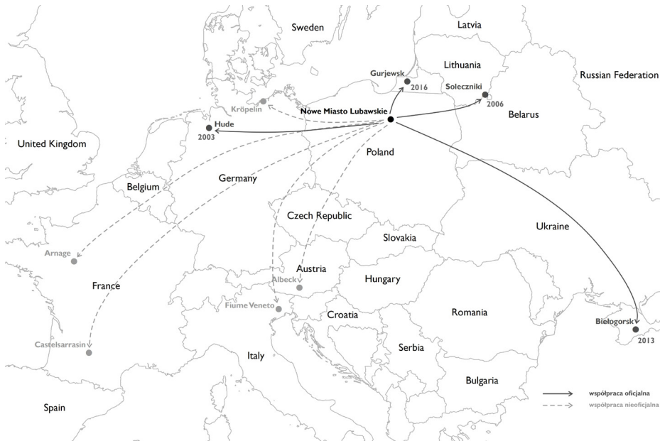
Ryc. 5. Mapa partnerów międzynarodowych Nowego Miasta Lubawskiego