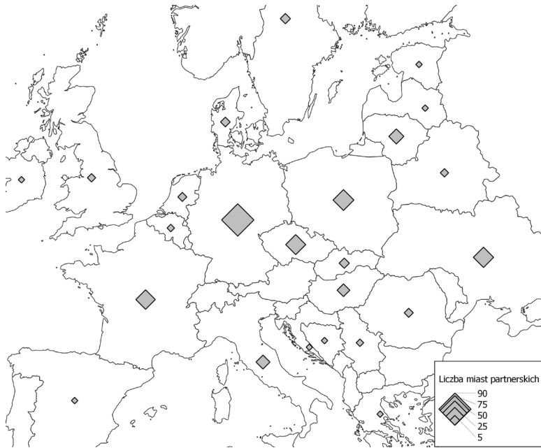
Ryc. 3. Liczba zawartych umów partnerskich przez badane miasta według krajów Europy (stan na 2017 r.)