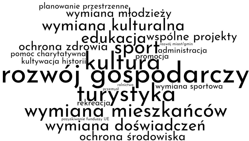
Ryc. 4. Chmura słów ilustrująca częstość występowania dziedzin współpracy w umowach partnerskich badanych miast (stan na 2017 r.)