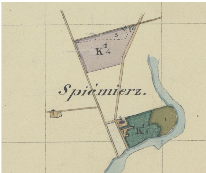
Ryc. 6. 1847 r. – mapy posiadłości probostwa w Spycimierzu Plan gruntów probostwa we wsi Spycimierz w powiecie tureckim (1847 r.); AGAD – Zbiór Kartograficzny 555-25