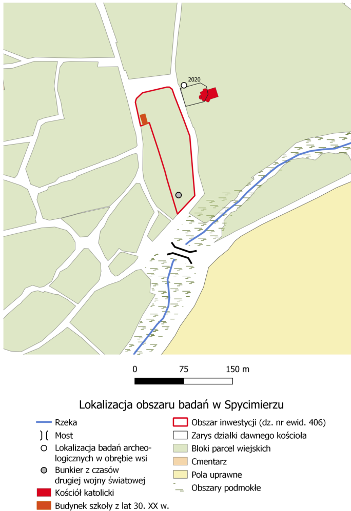
Ryc. 1. Lokalizacja badanego obszaru w Spycimierzu

z przebiegiem łączących się w niej traktów dalekosiężnych po przeanalizowaniu map tego rodzaju nie poczyniono spostrzeżeń bezpośrednio związanych z głównym problemem badawczym: układem parcelacji wewnątrz wsi. Z tego względu zdecydowano się oprzeć na mapach o większej skali, poczynając od 1:50 000 (mapa Gilly'ego z 1793 r. – zbiory Staatsbibliothek zu Berlin). Istotnych informacji dotyczących przemian przestrzeni Spycimierza w XIX w. dostarczyły mapy z lat 1804, 1845 (odrys z 1861 r.) i 1847, przechowywane w Archiwum Głównym Akt Dawnych. Dla potwierdzenia wniosków wysuniętych z analizy map przestrzeni wsi