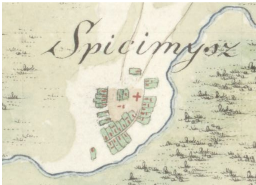
Ryc. 3. Mapa Gilly'ego z 1793 r. – otwarty układ przestrzenny Spycimierza z częściowo jeszcze niezabudowanym wnętrzem placu i początkiem parcelacji na terenie inwestycji

Aktualnie układ przestrzenny Spycimierza zaliczany jest do tzw. wielodrożnic. Proces jego kształtowania się może zostać częściowo prześledzony na podstawie zachowanych materiałów kartograficznych, pochodzących z XVIII w. oraz z przełomu XVIII/XIX w., a więc z pominięciem głównego okresu funkcjonowania osady (XI/XII–XVIII w.).