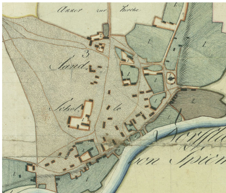
Ryc. 5. Mapa z 1804 r. – zbliżenie na centrum wsi, z widoczną parcelacją obszaru na wprost kościoła (teren inwestycji), zabudową i przebiegiem dróg. Zabudowa skupiona jest w północnej części posesji

Na wprost od kościoła wyraźnie oznaczone zostały parcele zamarkowane kolorem zielonym (oznaczającym ogrody). Duża działka wytyczona naprzeciw świątyni miała kształt zbliżony do nieregularnego trapezu. W jego północnej części rozciągał się (z zachodu na wschód) przejezdny dziedziniec podwórza, przy którym skupiono zabudowę. Stanowiły ją trzy budynki, wzniesione na obu skrajach dziedzińca – na wprost kościoła