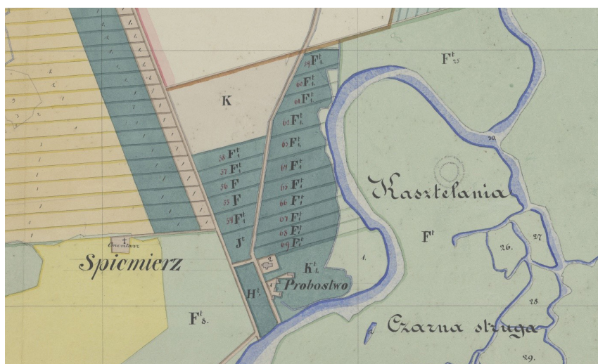
Ryc. 7. 1845 r. (odrys z 1861 r.) – regulacja części wsi (fragment mapy)

Mapa z lat 1845/1861 przedstawia przede wszystkim parcelację nowo wyczonej kolonii i pomija parcelację zachodniej części „starej” wsi. Widoczny jest układ działek na północ od kościoła, skupionych wzdłuż dróg opuszczających Spycimierz w kierunku północnym. Po raz pierwszy przedstawiony został istniejący do dziś układ dróg opuszczających wieś w północną stronę, z prostą zachodnią drogą w obecnej lokalizacji (rozmierzone zostały przy tym położone wzdłuż niej posesje). Widoczny jest kościół, zlokalizowany w obrębie czworokątnego placu, oraz majątek Probostwo, przylegający do terenów kościelnych od południowego wschodu. Wewnątrz pierwotnego targowiska oznaczono pojedynczą parcelę, ciągnącą się od rozwidlenia dróg w kierunku południowym aż do koryta rzeki. Prawdopodobnie obszar ten zawiera