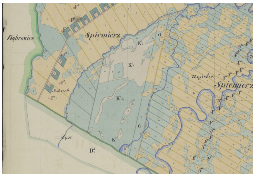
Ryc. 2. Południowo-zachodnia granica majątku Spycimierz na sporządzonym w 1861 r. odrzynie mapy regulacyjnej z 1845 r.