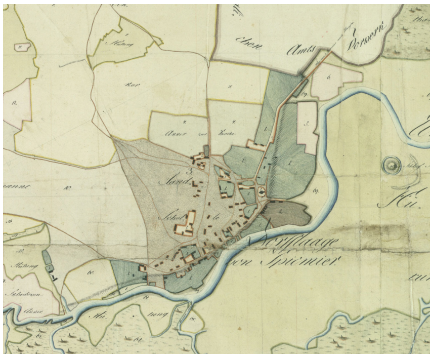
Ryc. 4. Mapa z 1804 r. – układ wsi

Plan wsi Spycimierz w ekonomii Uniejów (1804 r.); AGAD – Zbiór Kartograficzny, 344-4