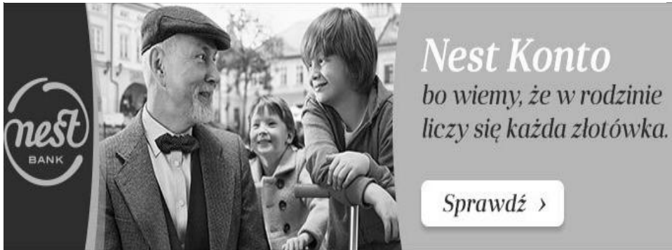
Rysunek 1. Wycinek oferty Nest Banku S.A.

niez jest zdecydowanie wyższy [Kacprzak 2012: 135]. W reklamach pojawia się mnóstwo tego typu metod zwanych potocznie „gwiazdkami” czy „haczykami”, które czynią ofertę atrakcyjną, mimo że do tej kategorii, z punktu widzenia klienta, nie należą.