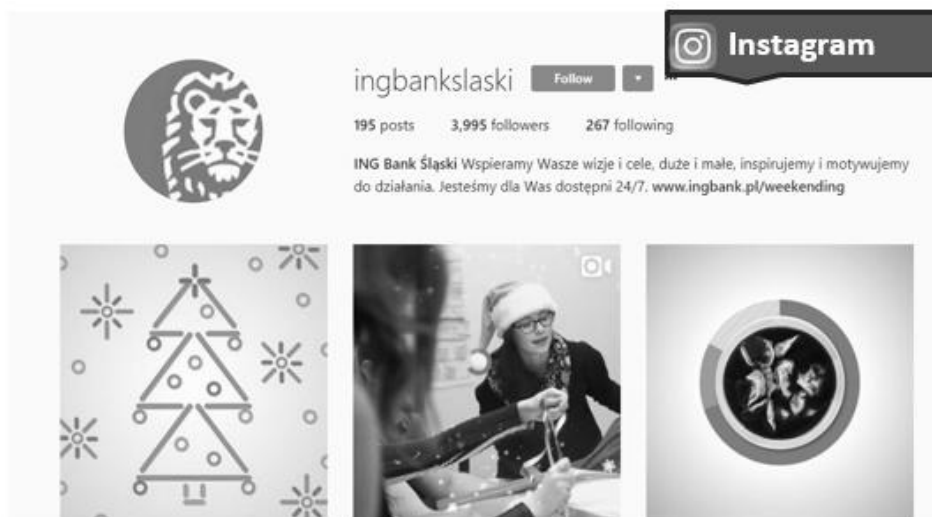
Rysunek 4. Fragment oficjalnej strony banku ING Banku Śląskiego S.A. na Instagramie