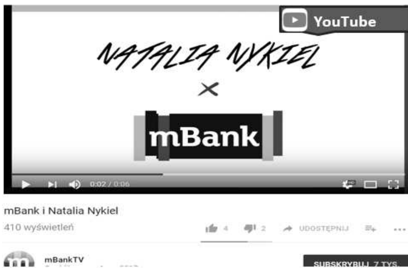
Rysunek 5. Kadr z reklamy mBanku S.A. na YouTube