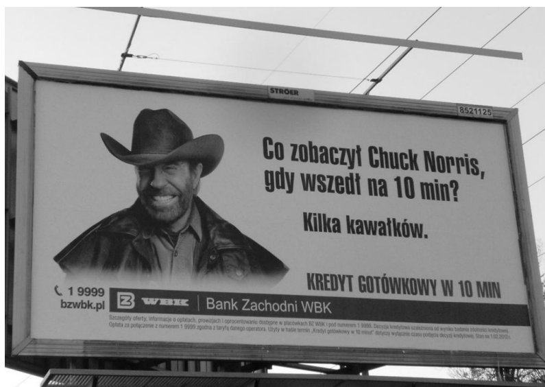
Rysunek 6. Bilboard banku BZ WBK S.A.