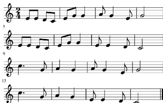
Ryc. 1. Zapis melodii prezentowany osobom badanym

Jako drugie zadanie wykorzystany został test uwagi ekstensywnej (Roczniewska, Sterczyński, Popławska, Kolańczyk 2012). W niniejszym badaniu wykorzystana została komputerowa wersja testu, napisana w programie Inquisit 4.0. Test zawiera 360 liter (a; d; e; k; s; w) ułożonych w 11 koncentrycznych elips. Każda litera występuje w teście 60 razy. Osoby badane mają za zadanie znaleźć jak najwięcej liter 'd'. Zaznaczona przez osobę badaną litera zmienia kolor z czarnego na zielony (rycina 2). Czas rozwiązywania całego zadania wynosi 2 minuty. Test prezentowano przy użyciu laptopa z ekranem 17". Badania przeprowadzono indywidualnie w sali ćwiczeniowej Akademii Muzycznej w Krakowie.