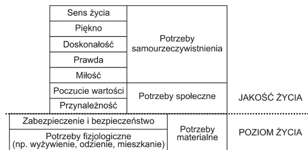
Rysunek 1. Poziom i jakość życia a hierarchia potrzeb

W niniejszym opracowaniu starano się odpowiedzieć na pytanie, czy i w jaki sposób wirtualne społeczności lokalne mogą wpływać na jakość życia mieszkańców miasta, czy raczej – jego konkretnej dzielnicy. Czym zatem jest jakość życia (ang. quality of life )? Możemy ją definiować jako stopień zaspokojenia ludzkich potrzeb, zarówno materialnych, jak i niematerialnych. Przy czym często stopień zaspokojenia potrzeb materialnych (utożsamianych zwykle z potrzebami niższego rzędu) jest nazywany poziomem życia (ang. level of living ), zaś zaspokojenie potrzeb niematerialnych (utożsamianych z potrzebami wyższego rzędu) określa się właśnie mianem jakości życia (Kędzior, 2003) (zob. rysunek 1).