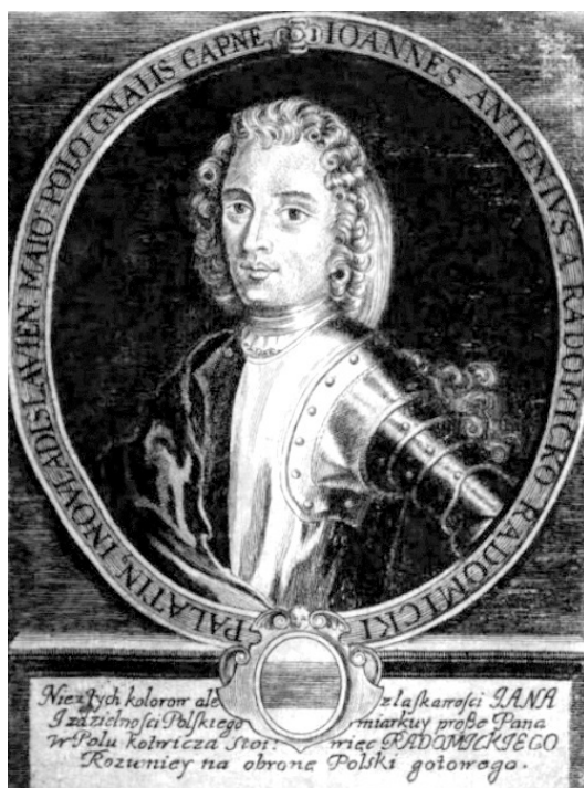
Portret Jana Antoniego Radomickiego z publikacji Augustyna Kołudzkiego, Thron ojczysty albo pałac wieczności w krótkim zebraniu monarchów, xiążąt y królów polskich ... , Drukarnia Akademicka, Poznań 1727, bns